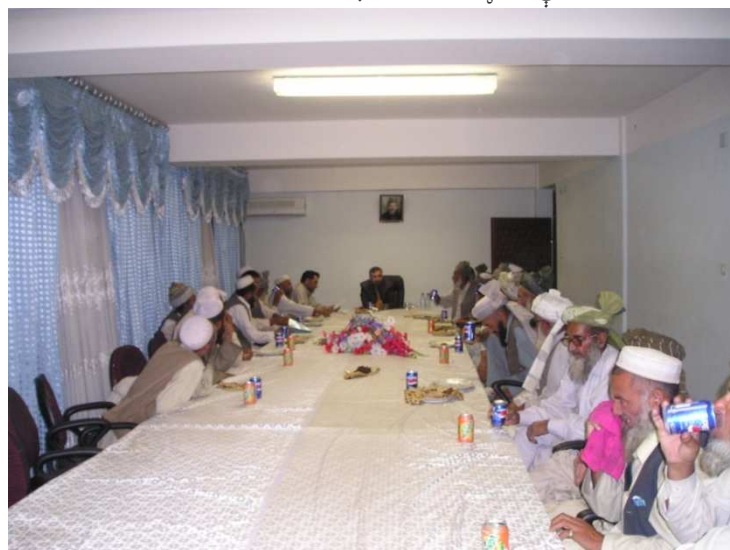
د خاص کنړ د ولسوالۍ د قومي مشرانو سره لیدنه (د کورنیو چارو وزارت)