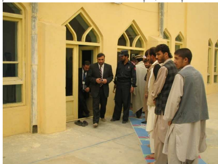
د کارته نو په سیمه کې شاه محمود میاخیل د ټاکنیزې حوزې څخه د کتنې پر مهال