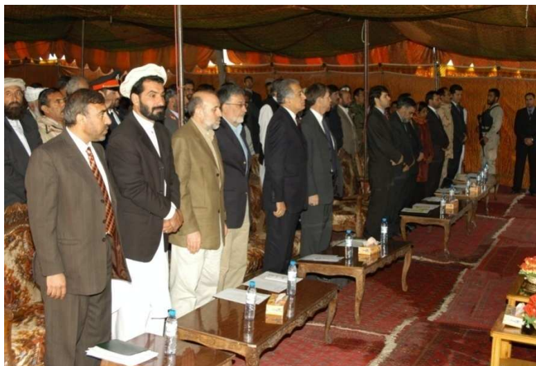
له کني خوا نه لومړي قطار، شاه محمود مياخيل، شهزاده مسعود، محمد عمر داودزی، زلمی رسول، زلمی خليل زاد (USID) مشر، جاويد لودين، محمد يوسف پښتون، اميره حق (UNAMA) مرستياله، شيدا محمد ابدالي، جنرال عبدالهادي خالد او ولي منور (لوگر محمد اغه ولسوالي)