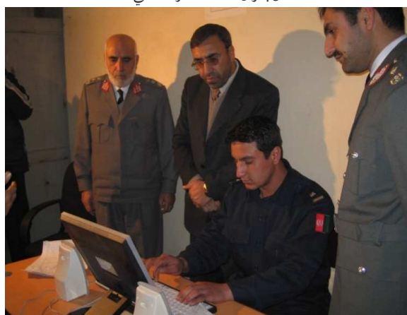
د کورنیو چارو وزارت د پیژنتون د اسنادو د کمپیوټري کولو نه کتنه