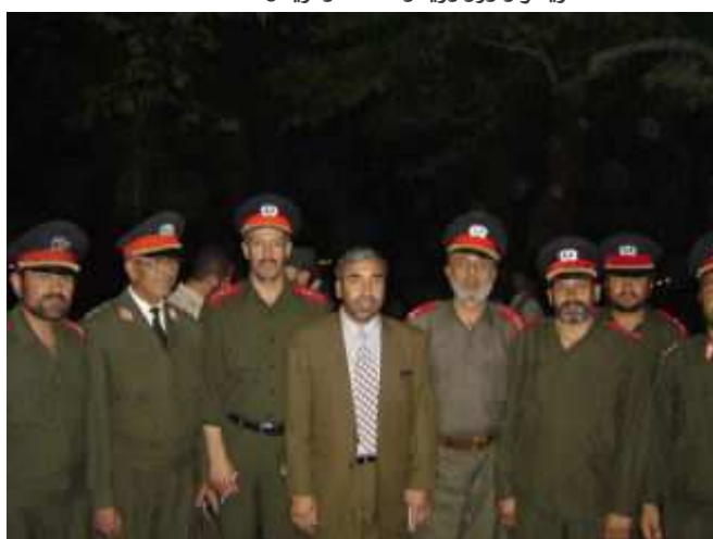
شاه محمود میاخیل د کورنیو چارو وزارت ریښانو او قوماندانو سره (ارکې مانی)