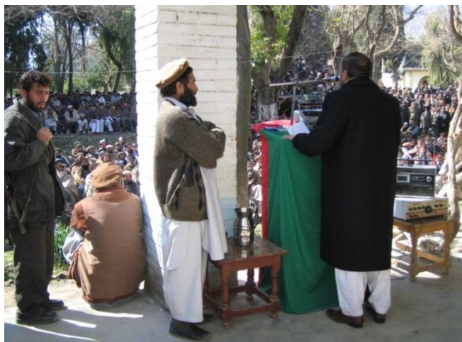
شاه محمود میاخیل د کنړ نوي والي اسدالله وفا د معرفي کیدو لویه مراسمو کې د کنړ خلکو ته وینا پر مهال