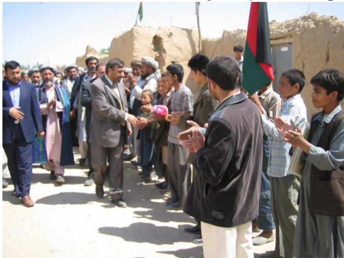
د بلخ ولایت د شولگری ولسوالي د خلکو سره کتنه