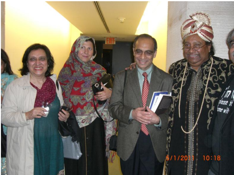
هم ددي وخت يو بل عكس