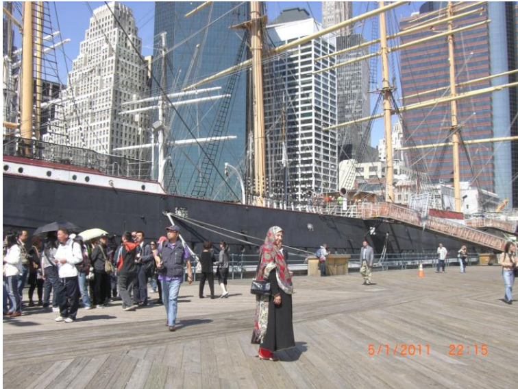
د سمندر د غاړې يو بل عكس