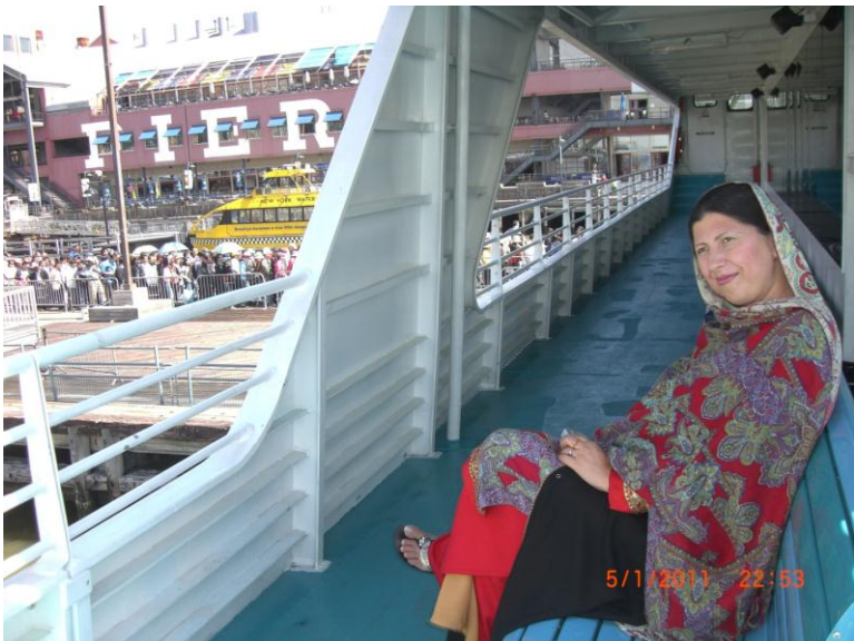
د کبنتی په اخري منزل کی د ناستی پر مهال