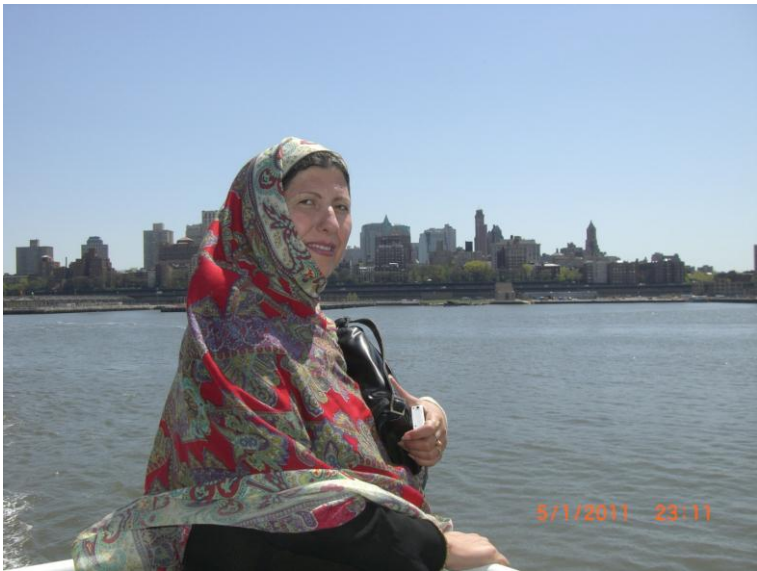
یو بل بنکاره عکس د نیویارک سمندر