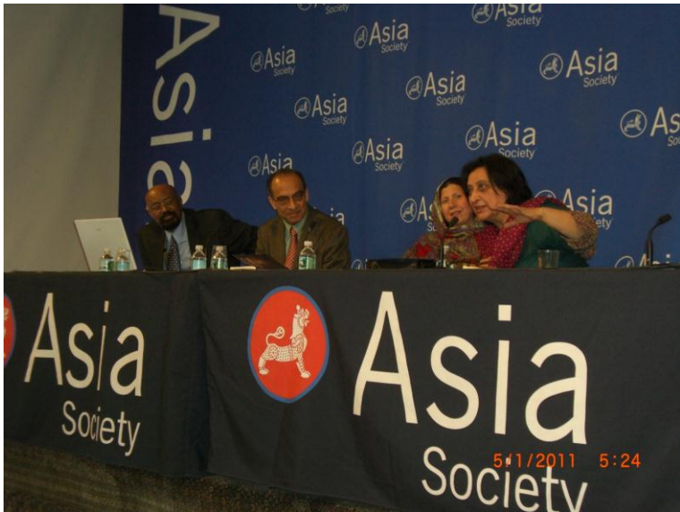
فهمیده ریاض د وینا کولو پر مهال