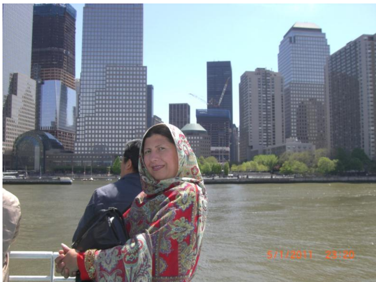
د بنار يو بل منظر د سمندر نه