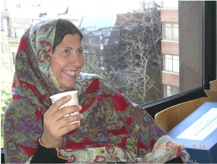
د ایشیاء سوسایټی دفتر