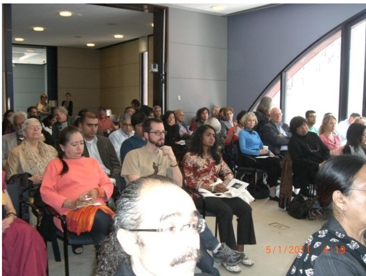
د نیو یارک د دستوري یو بل عکس