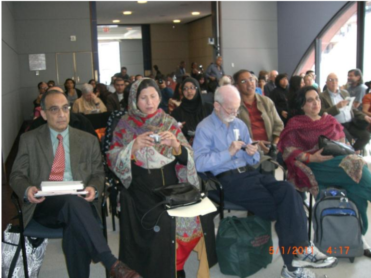
په نیو یارک کې د دستوری پر مهال