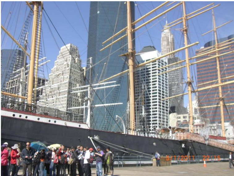
د سمندر د غاړي يو بل عکس