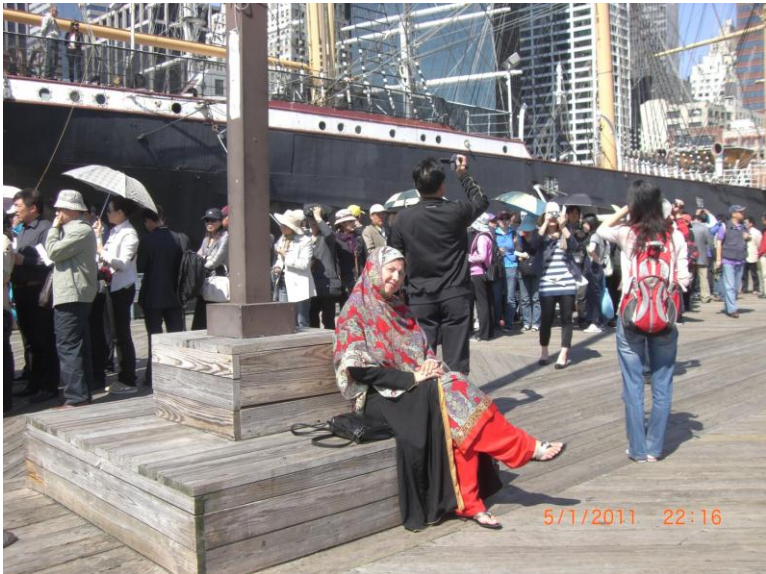
د نيو يارک د سمندر د غاړې يو بل عكس