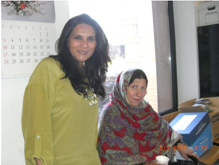
د ایشیاء سوسائیتی نیو یارک په دفتر کې