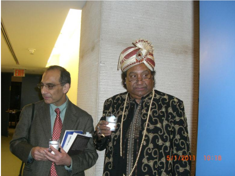
خدای بینلی افتخار نسیم او وقاص خواجه