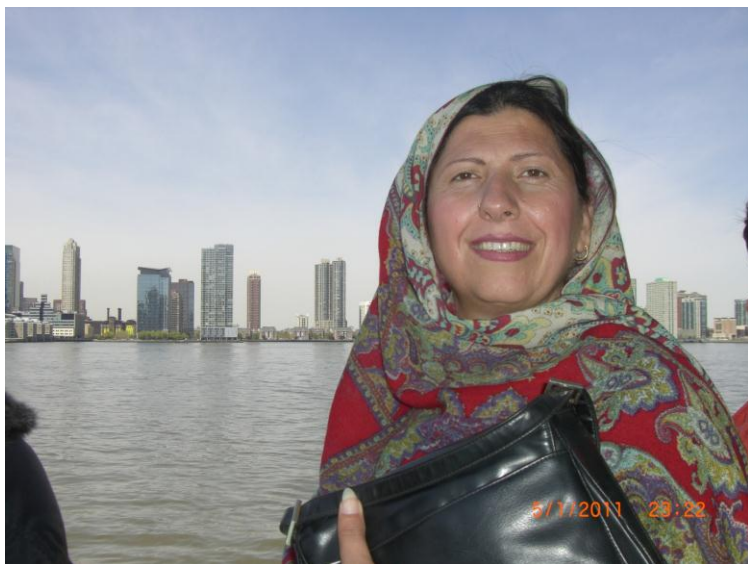
د بلي غاري سيل