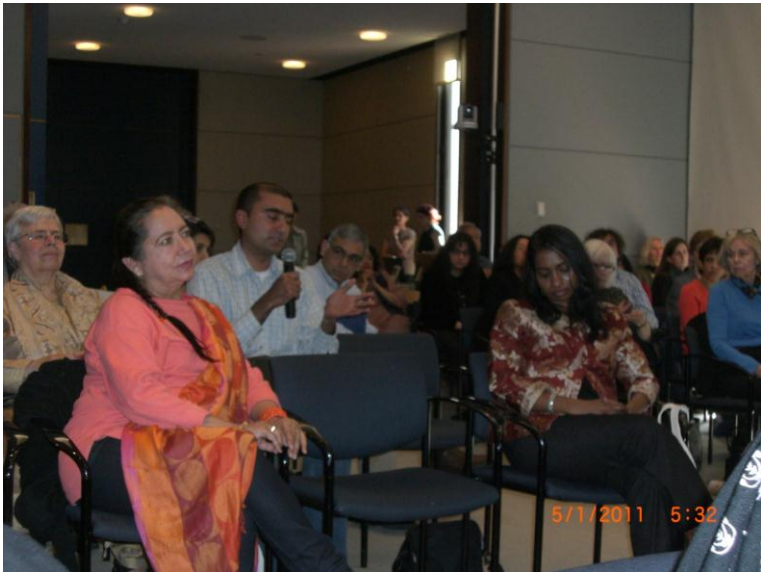
د غونډې نور گډونوال د پوښتنو پر مهال