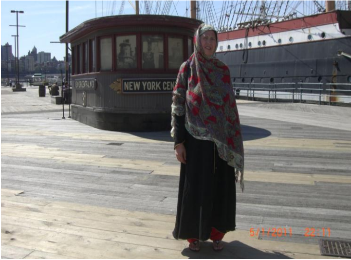
نيو يارک کي د سمندر د سيل پر مهال