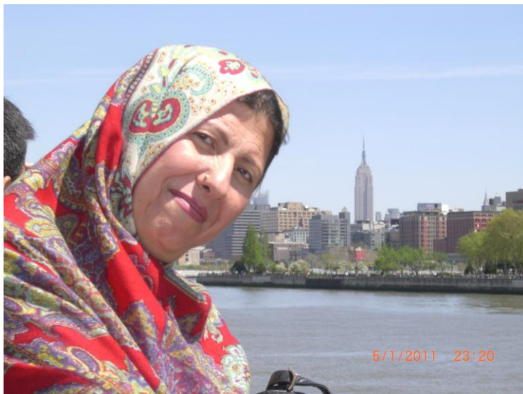
نیو یارک بنار د کشتی سیل او سمندر غاره