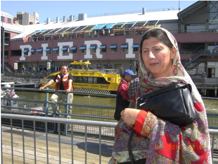
په کشتی کی د ناستی پر وخت یو عکس