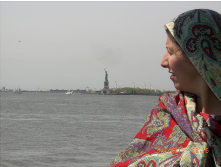
يو بل عکس د سمندر د غاړې