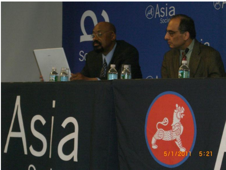
ددي دستوري يو بل عكس