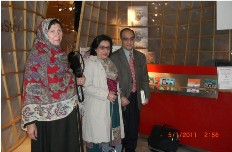
په نیو یارک کي د دستوري نه مخکي