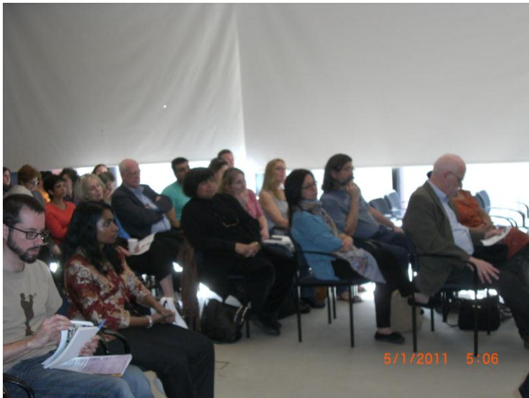
د غونډی نور گډونوال