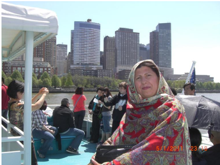
راغلي سيلگر، او زه