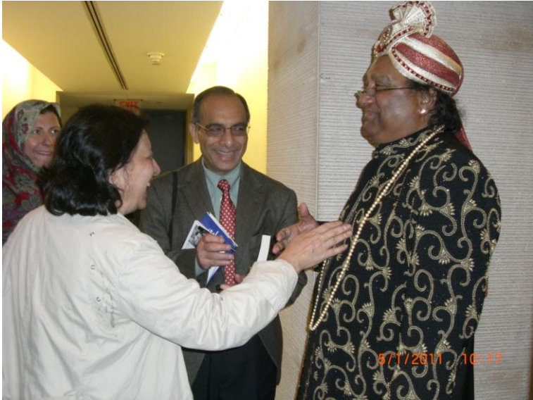
افتخار نسيم وقاص خواجه فهميده رياض او حسينه گل د دستوري نه پس