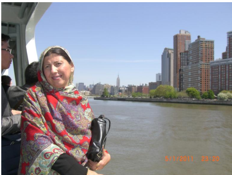
د سمندر چکر د بلی غاړې سفر