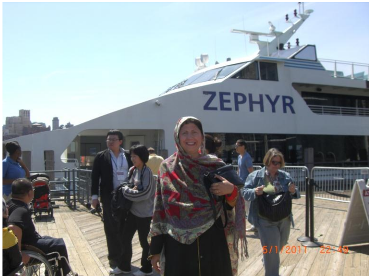
یو بل عکس