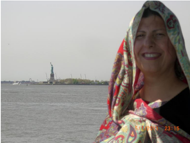
د سمندري هواگانو په ټيل نا ټيل کې