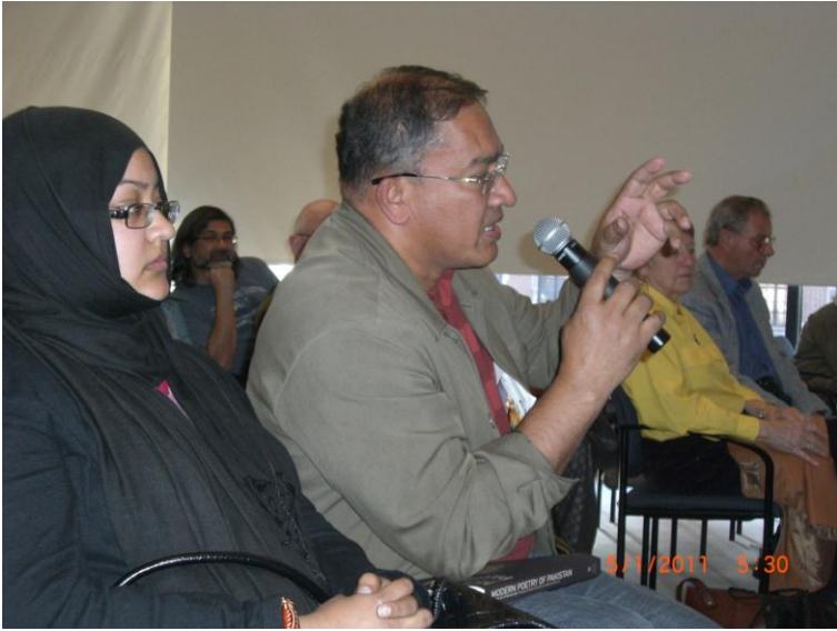
د پوښتنو او ځوابونو پر مهال