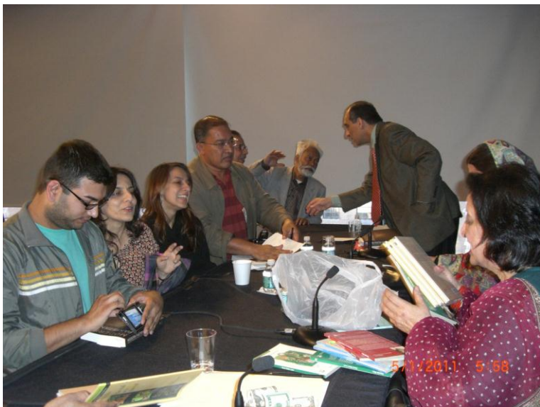
د فهمیده ریاض د کتابونو خرڅېدل