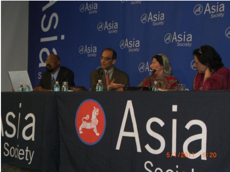
د ایشیاء سوسائیتی یو رابطه کار، وقاص خواجه حسینه گل او فهمیده ریاض