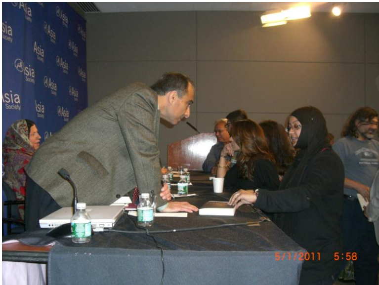
د کتاب د پلورلو پر مهال