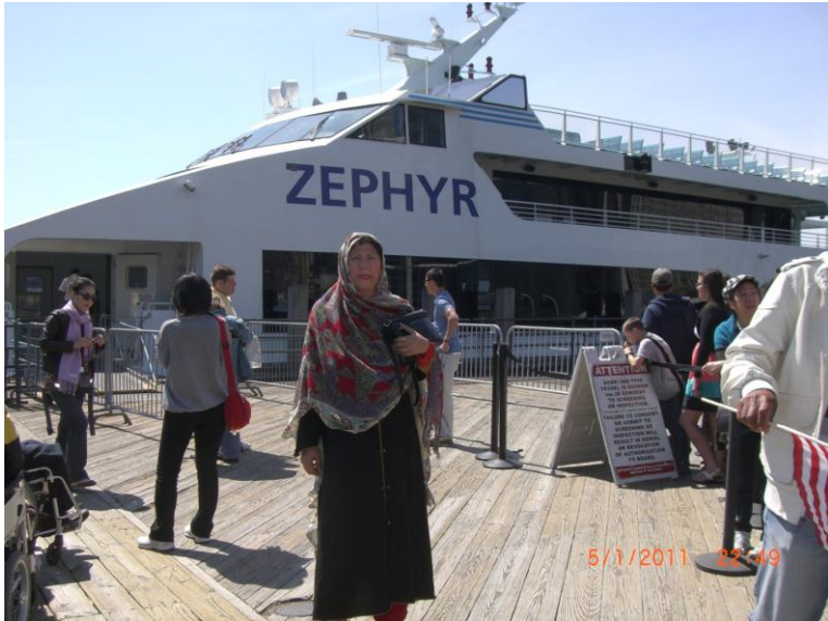
کشتی کی د کیناستو نه وړاندې