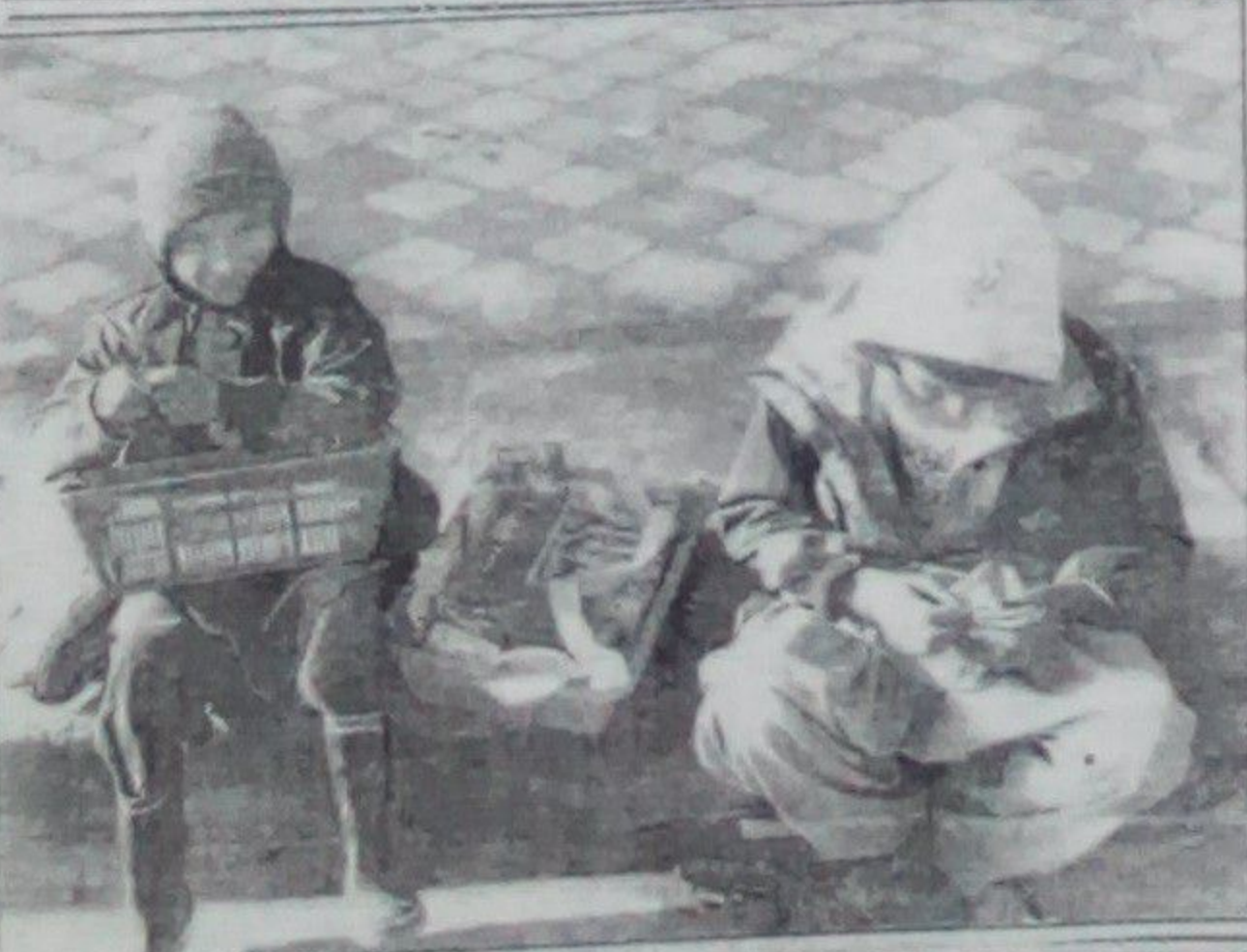
تهیه کننده: یوسف یوسنی