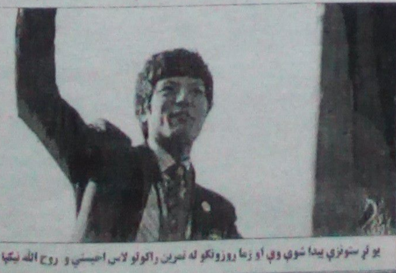
یو لږ ستوري پیدا شوي وي او زما روزونکو له تمرین راتلونو لاس اخیني و روح الله نېکيا

د لندن او بیجنگ په اولمپیک کې مډال ګټونکي روح الله نېکيا د مکسیکو د تګوانتو په نړیوالو سیالیو کې له ګډون کولو ډډه کړې دي وايي د افغانستان د تګوانتو په فدراسیون کې زلمي ستوري دي او که همداسې دوام وکړي نو په هېڅ ډول رسمي سیالیو کې، برخه نه اخلي. له کبله د یې یې ښې خیرات حیقه الله صروف په رپوټ کې د افغانستان د المپیک ملي کمیټې چارواکو له قوله ویل شوي، چې وايي ښاغلي نېکيا د شخصي لاملونو له کبله په دغو سیالیو کې نه ګډون کولو ډډه کړې ده د بیجنگ او لندن د روزنې د دوهمې درجې او لومړنۍ درجې کورسونه او اوس مهال په عمان کې د ملي لوبغاړو لپاره د دوهمې درجې لوبغاړی کورسونه د سېسې په کچه ښې سازي لمانځونه دي ښاغلي سردار د نمیبیا او په سمیتاپور کې د اېمرحک سالیو لپاره د ملي لوبغاړو چمتووالي او د لوبغاړي لپاره د لوبغاړو ټاکنې په اړه هم اړین معلومات وړاندې کړل د ناستې په ترڅ کې د افغانستان ګرېکټ بورډ اجرائیوي رایس ډاکټر نور محمد مراد د بیجنگ همکارانو ټولو پوښتنو ته د ملت وړ ځوابونه ورکړل