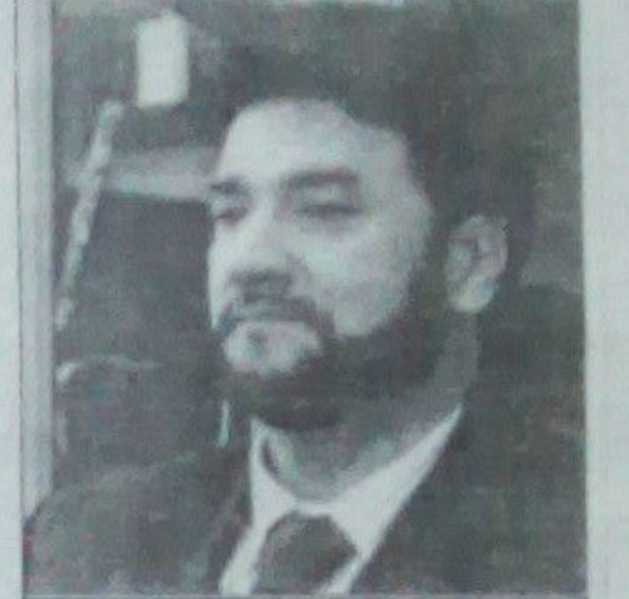
پر ښاغلي اغیر تور لگېدلی چې ګواکې نړیوالو سیالیو ته د لوبغاړو د استولو په برخه کې د مور او مېرې چلند کوي

د افغانستان د اولمپیک د ملي کمیټې مشر د یو شمېر لوبغاړو د سرکونو او د کلني پرمختیایي بودجې د نه لگولو له کبله ولسي جرگې ته غوښتل شوی و. پر ظاهر اغیر داسې توروڼه ورپیلې و پر ښاغلي اغیر دا تور هم لگېدلی چې ګواکې نړیوالو سیالیو ته د لوبغاړو د استولو په برخه کې د مور او مېرې چلند کوي. د افغانستان د اولمپیک د ملي کمیټې مشر ظاهر اغیر په ده لگېدلي توروڼه ښې نښتې وپیلې او بی بي سي ته یې وویل چې د لوبغاړو د نیولو پر اړه مخامخ نه هڅو سره غږېدلی دی د افغانستان د اولمپیک ملي بنسټ مخکې له دې هم له لوبغاړو سره په دوه مخي چلند توروڼ شوی و همدا راز د اداري درغیلو او د فدراسیونونو د مشرانو د ټاکلو په برخو کې له نیوکو سره مخامخ و او یو ځل حوډا لگولو توانېدلی دی. د اولمپیک د ملي کمیټې مشر دا توروڼه رد کړې دي د ولسي جرگې د روغتیا او بدني روزنې