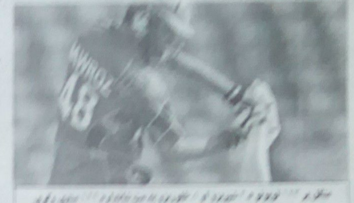
د افغانستان ملي لوبډله د منگل په ضد کې د لومړي ځل لپاره د خپل ملي لوبډله له ماتې نه زغوره کړه.

افغانستان د لومړي ځل لپاره په خپل ملي لوبډله کې د منگل په ضد کې د لومړي ځل لپاره د خپل ملي لوبډله له ماتې نه زغوره کړه. د افغانستان ملي لوبډله د منگل په ضد کې د لومړي ځل لپاره د خپل ملي لوبډله له ماتې نه زغوره کړه. د افغانستان ملي لوبډله د منگل په ضد کې د لومړي ځل لپاره د خپل ملي لوبډله له ماتې نه زغوره کړه.