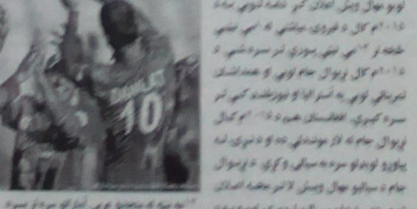
پاکستان او نيوزيلنډ تر منځ په درېيم ټيسټ کې د وروستۍ وخته کوي.

پاکستان او نيوزيلنډ تر منځ په درېيم ټيسټ کې د وروستۍ وخته کوي. پاکستان او نيوزيلنډ تر منځ په درېيم ټيسټ کې د وروستۍ وخته کوي. پاکستان او نيوزيلنډ تر منځ په درېيم ټيسټ کې د وروستۍ وخته کوي.