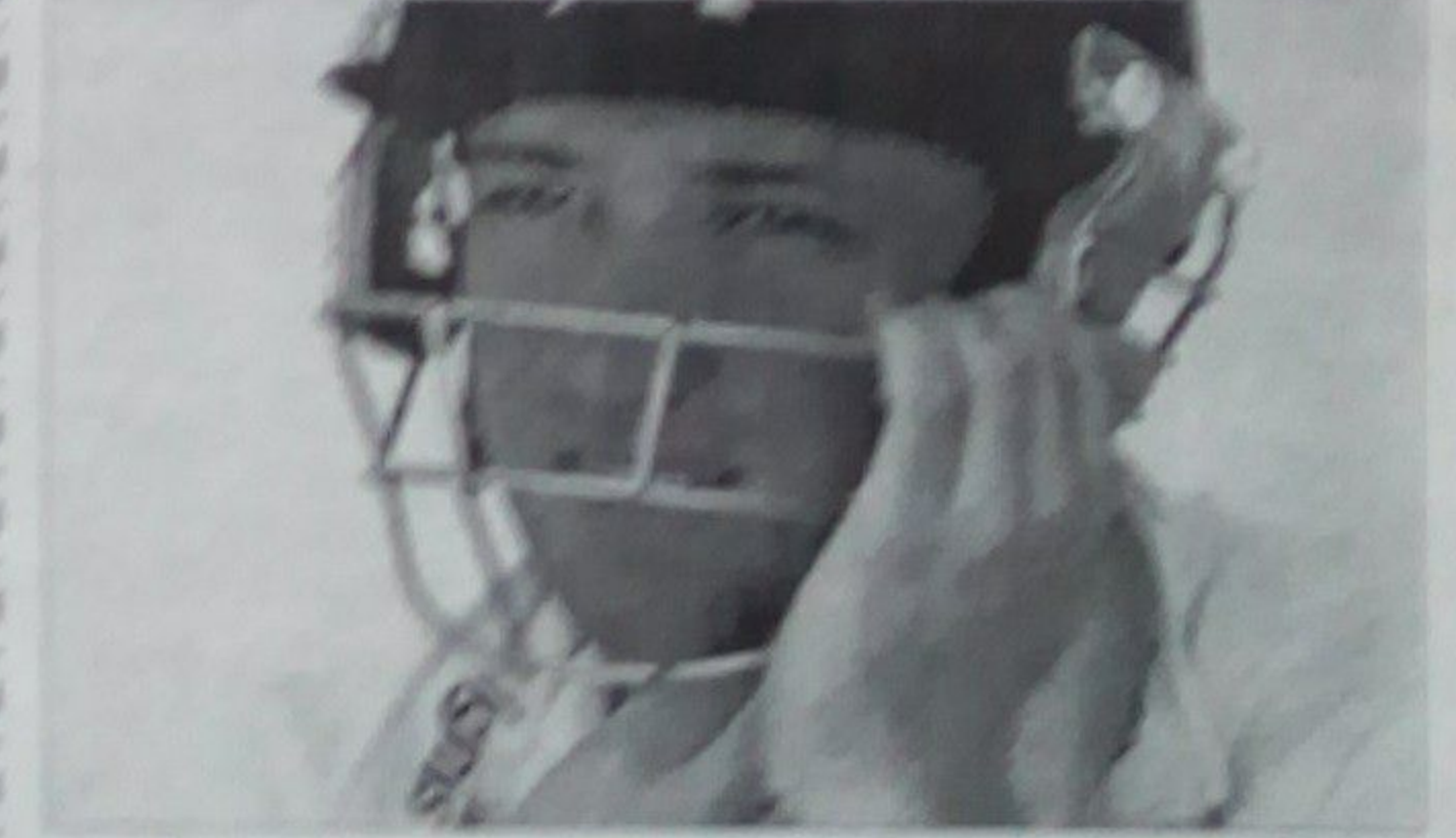
د اسټراليايي لوبغاړي چې په سر لگېدلي و پر شو.

د اسټراليايي لوبغاړي چې په سر لگېدلي و پر شو. د اسټراليايي لوبغاړي چې په سر لگېدلي و پر شو. د اسټراليايي لوبغاړي چې په سر لگېدلي و پر شو.