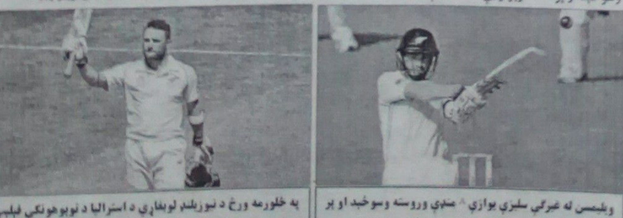
پاکستان او نيوزيلنډ تر منځ په درېيم ټيسټ کې د وروستۍ وخته کوي.

پاکستان او نيوزيلنډ تر منځ په درېيم ټيسټ کې د وروستۍ وخته کوي. پاکستان او نيوزيلنډ تر منځ په درېيم ټيسټ کې د وروستۍ وخته کوي. پاکستان او نيوزيلنډ تر منځ په درېيم ټيسټ کې د وروستۍ وخته کوي.