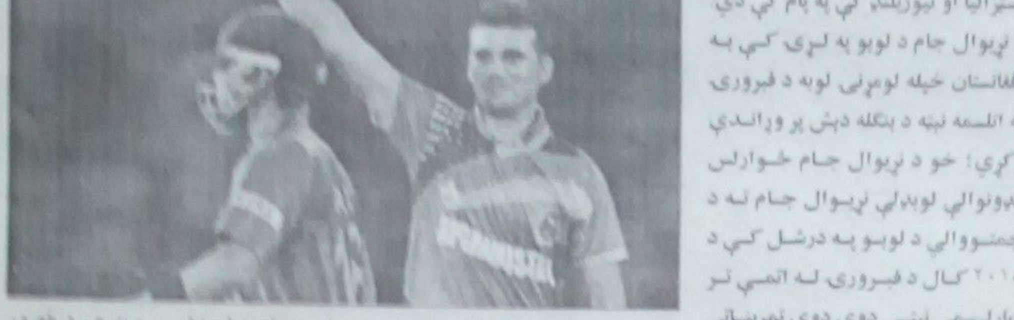
د افغانستان د کرېکټ ملي لوبډله د فبرورۍ په ۱۰مه له هند سره لوبه کوي.

افغانستان د کرېکټ ملي لوبډله د فبرورۍ په ۱۰مه له هند سره لوبه کوي. د افغانستان د کرېکټ ملي لوبډله د فبرورۍ په ۱۰مه له هند سره لوبه کوي. د افغانستان د کرېکټ ملي لوبډله د فبرورۍ په ۱۰مه له هند سره لوبه کوي.