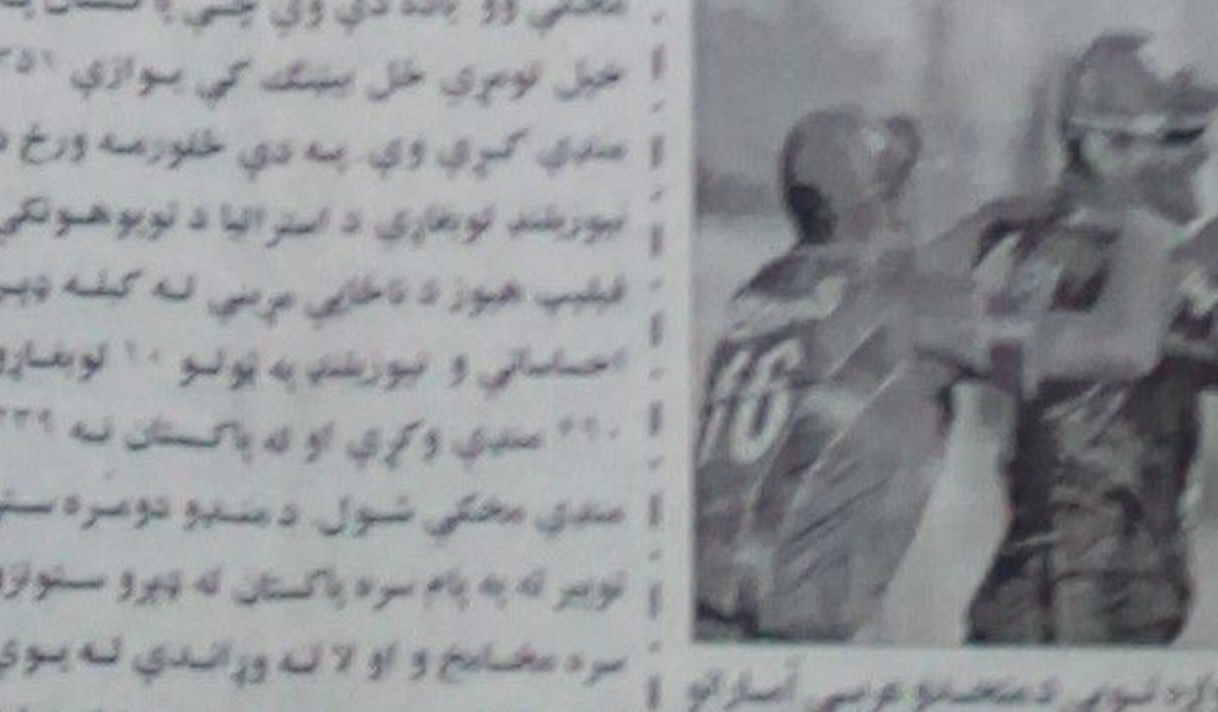
پاکستان او نيوزيلنډ تر منځ په درېيم ټيسټ کې د وروستۍ وخته کوي.

پاکستان او نيوزيلنډ تر منځ په درېيم ټيسټ کې د وروستۍ وخته کوي. پاکستان او نيوزيلنډ تر منځ په درېيم ټيسټ کې د وروستۍ وخته کوي. پاکستان او نيوزيلنډ تر منځ په درېيم ټيسټ کې د وروستۍ وخته کوي.