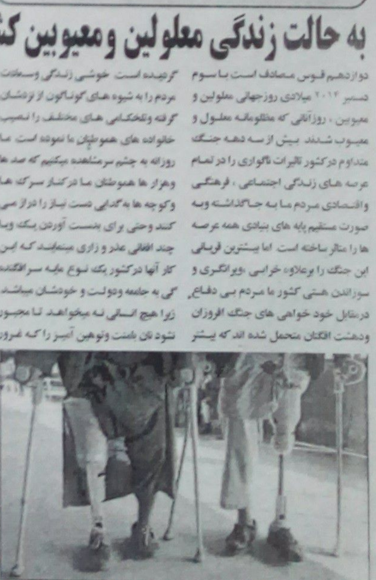
از هشت صدو پانزده هزار معلول و معيوب به جا گذاشت و تا امروز دولت افغانستان بې و تلاش خود نوانست کوجکترين کنور ما دولت را به ايچا جلمه عرفه، ترقي و نساين حقوق بشر و عدالت اجتماعي و تحقن دموکراسي مختلف گرديده است و لاسان دپني و مندهي کنور مايز حکم مينمايد که بايد از در مائه گان، معلولين و معيولين خويش و ارسي و دلجوئي تعليمي و عزت نفس و کرامت انساني آنان را حفظ و حرمت يگانديزم و طوري زندگي خوب و بهتر و آيوومندي را براي شان هيايگر داييم که به حيث