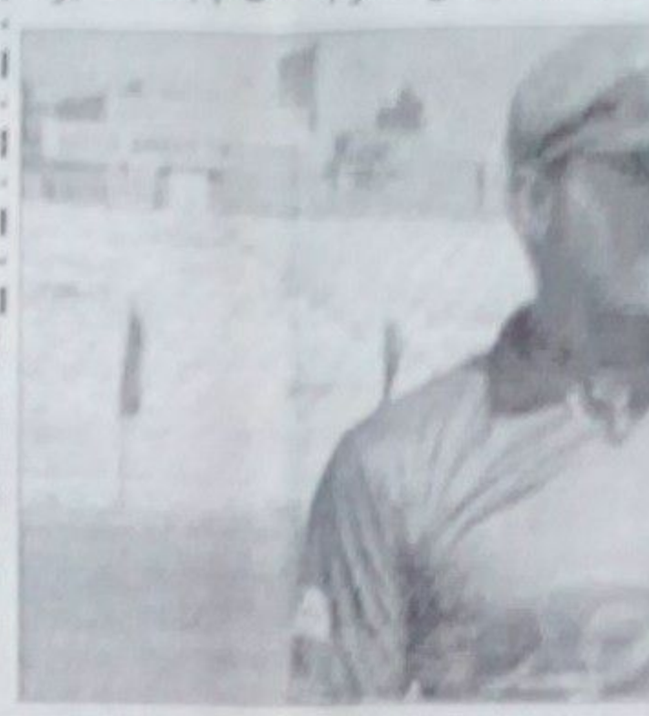
پاکستان او نيوزيلنډ تر منځ په درېيم ټيسټ کې د وروستۍ وخته کوي.

پاکستان او نيوزيلنډ تر منځ په درېيم ټيسټ کې د وروستۍ وخته کوي. پاکستان او نيوزيلنډ تر منځ په درېيم ټيسټ کې د وروستۍ وخته کوي. پاکستان او نيوزيلنډ تر منځ په درېيم ټيسټ کې د وروستۍ وخته کوي.