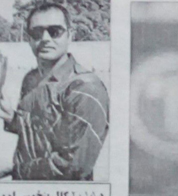
افغانستان او نيوزيلنډ تر منځ په درېيم ټيسټ کې د وروستۍ وخته کوي.

افغانستان او نيوزيلنډ تر منځ په درېيم ټيسټ کې د وروستۍ وخته کوي. افغانستان او نيوزيلنډ تر منځ په درېيم ټيسټ کې د وروستۍ وخته کوي. افغانستان او نيوزيلنډ تر منځ په درېيم ټيسټ کې د وروستۍ وخته کوي.