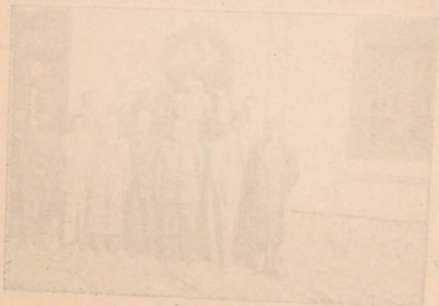
تصویری از یک جلسه یا گردهمایی در سال ۱۳۶۶