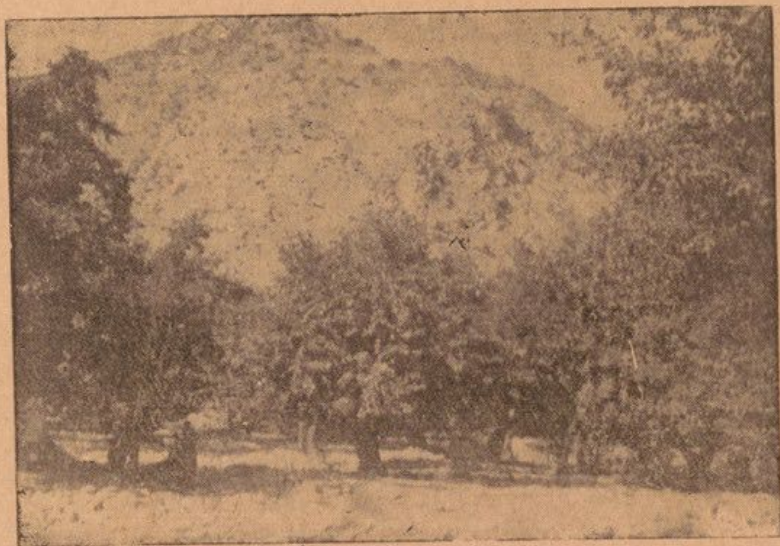
بدخشان يکه مغل ها که در بين درختان زندگی می کنند . مربوط به مقاله (آجسس مغل ها)