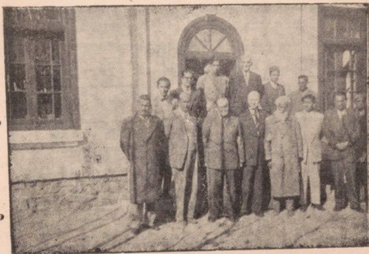
هیئت کلتوری شوروی بارئیس واستادان فاکولته ادبیات