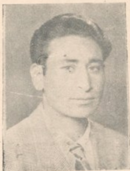
پروانه صنف دوم تاریخ و جغرافیه