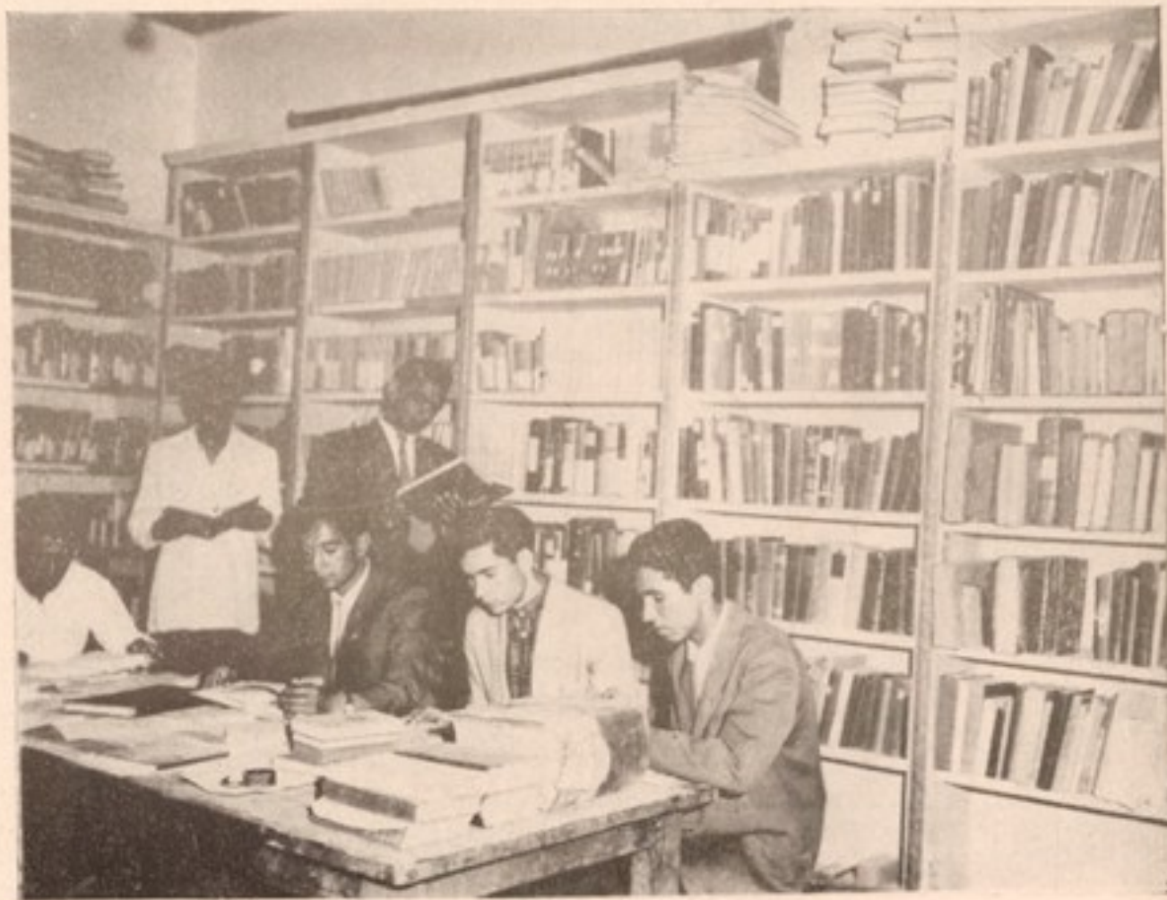
یسک تعداد محصلین پوهنځی در کتابخانه پوهنځی سرگرم مطالعه میباشند.

عی، دین، نکتات زلحاظ تشکیل سک ازین و... لسانی می باش... ماوراءالنهار صفحه (۱۸۱۶)