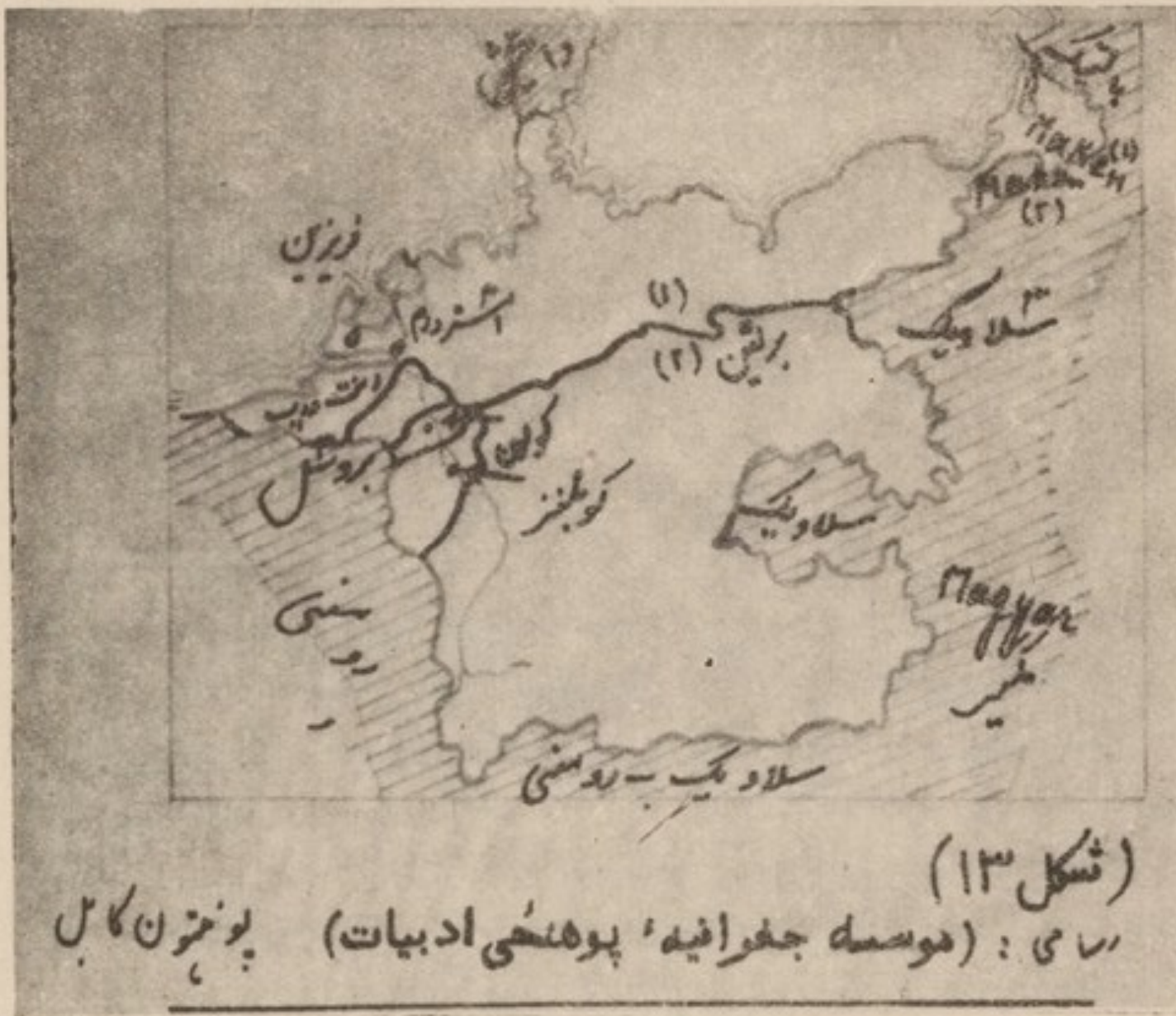
(شکل ۱۳) راسی: (موسسه جغرافیه، پوهنهی ادبیات) پونترن کابل

از گفتار فوق بر می‌آید که در سه لهجه یاد شده در اخیر، این صدا همان صوت ژرمانیک نخستین و هالندی میانه نیست، بلکه ساختمان این دو کلمه تغییر نیافته و تا کنون فونیم سیلابی آنها با هم مطابقت میدارد. معیناً، از ملاحظه نقشه بر می‌آید که این واول را در سه ناحیه وسیع در کلمه mous بصورت [u:] در کلمه hous بشکل [y:] بدینگونه [mu:shy;s] تلفظ میکنند. درین ناحیه‌ها روابط ساختمانی این دو کلمه تغییر یافته است، یعنی از لحاظ فونیم سیلابی تطابق نمیدارند.