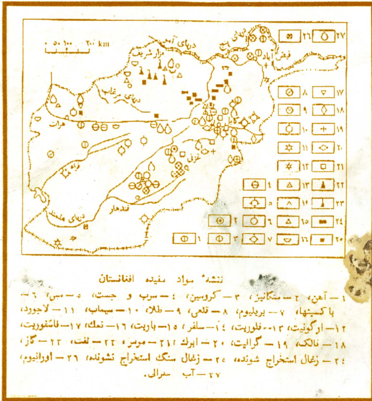
نشه مواد معدنی افغانستان

۱- آهن، ۲- مسکینز، ۳- کرومیت، ۴- سرب و جیست، ۵- مس، ۶- سولفور، ۷- یورانیوم، ۸- قلعی، ۹- طلا، ۱۰- سیماب، ۱۱- لاجورد، ۱۲- ارگونیت، ۱۳- فلوریت، ۱۴- سلفر، ۱۵- باریت، ۱۶- نمک، ۱۷- فاسفوریت، ۱۸- فالتک، ۱۹- گرافیت، ۲۰- ایرک، ۲۱- مورس، ۲۲- نفت، ۲۳- گاز، ۲۴- زغال استخراج شونده، ۲۵- زغال سنگ استخراج نشونده، ۲۶- اورانیوم، ۲۷- آب سرد.