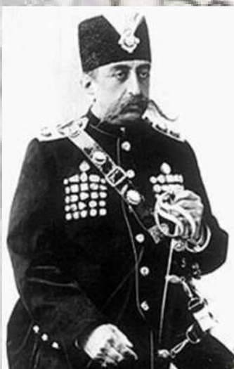
ناصرالدین شاه قاجار

امپراطوری آلمان مدتها بعد از امپراطوری های بریتانیا و روسیه در صحنه سیاسی و اقتصادی ایران ظاهر شد. در زمان صفویه و در دوران شاه عباس کوششی برای ایجاد روابط با آلمان به عمل آمد ولی به نتیجه نرسید. در نیمه قرن نوزدهم و