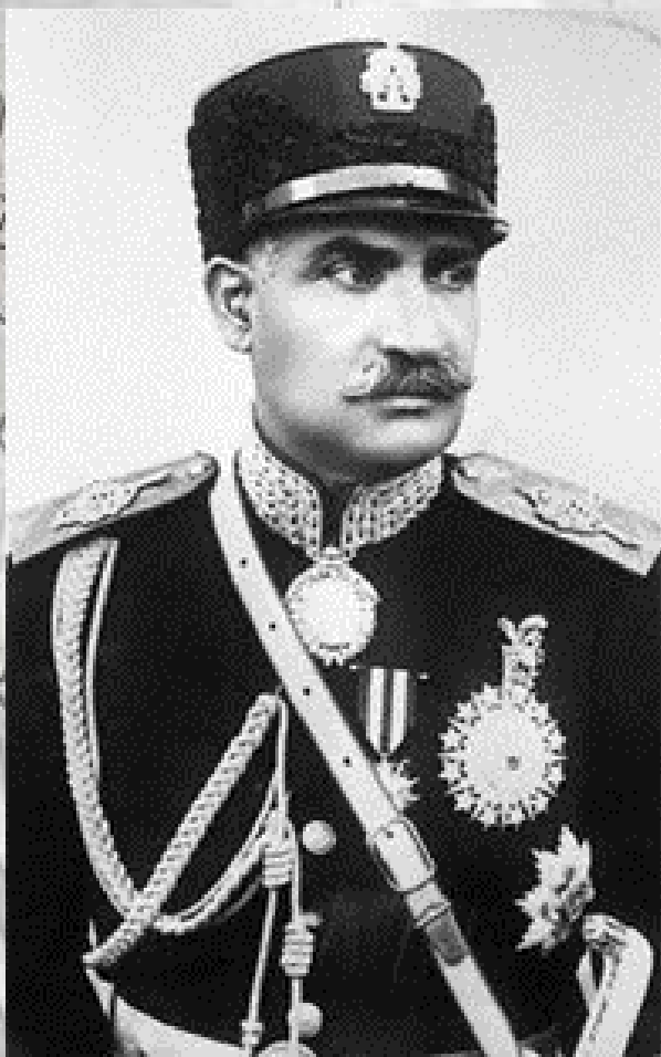
رضاخان، اولین شاه سلسله پهلوی

وقوع انقلاب کمونیستی در روسیه و کناره‌گیری موقت روسها از تحولات جهان سبب کاهش شدید نفوذ آنان در ایران شد. از سوی دیگر پیمان ۱۹۱۹ انگلیسی‌ها با دولت وثوق‌الدوله به دلیل مخالفت جدی رجال دلسوز و متعهدی چون مرحوم مدرس، عملاً بی‌اثر ماند و اعتبار انگلستان را نیز تا سر حد امکان در داخل کشور کاهش داد.