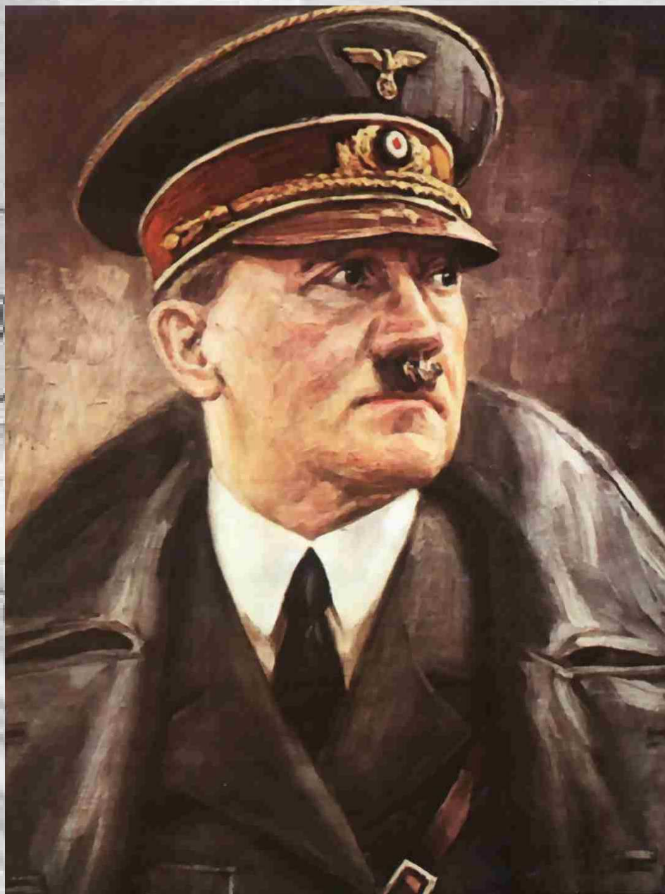
پیشوا آدولف هیتلر

ایران و آلمان در زمینه بازرگانی مکمل یکدیگر بودند. ایران مواد خام و محصولات کشاورزی و دامی مانند پنبه، غله، حبوبات، برنج، پشم، پوست، دانه‌های روغنی و قالی در اختیار آلمان قرار می‌داد و آلمان نیز تولیدات صنعتی، ماشین‌آلات، لوازم فنی، وسائط نقلیه، قند و شکر، دارو و مواد شیمیایی و کارخانجات مورد نیاز را به ایران صادر می‌کرد و از این لحاظ آلمان توانست تدریجاً موقعیت تجاری ممتازی در ایران به دست آورد. در زمینه تجارت خارجی به علت محدودیت‌هایی که دولت ایران از لحاظ اعتبار و پول بوجود آورده بود انگلیسی‌ها نتوانستند فعالیت‌های چشمگیر اقتصادی در ایران داشته باشند و در مقابل آلمان به بهره‌برداری از وضع پیش آمده پرداخت و با تأسیس کارخانه‌های متعدد در ایران و