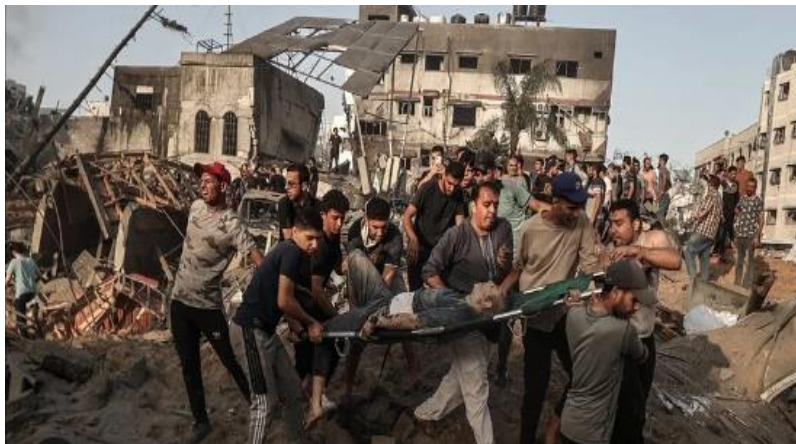
د غزي ترانگي انځور د جگړې ليکي نه