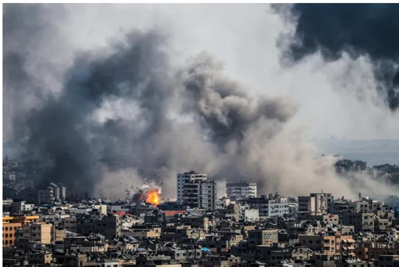
د غزي ترانگي انځور د جگړې ليکي نه