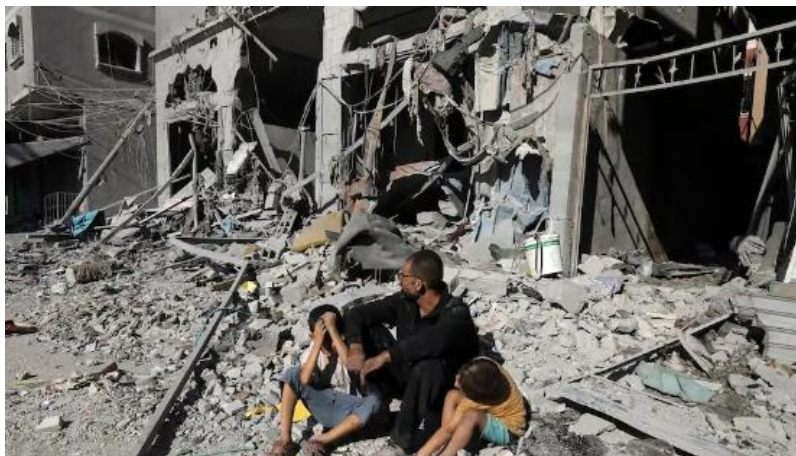
د غزي ترانگي انځور د جگړې ليکي نه