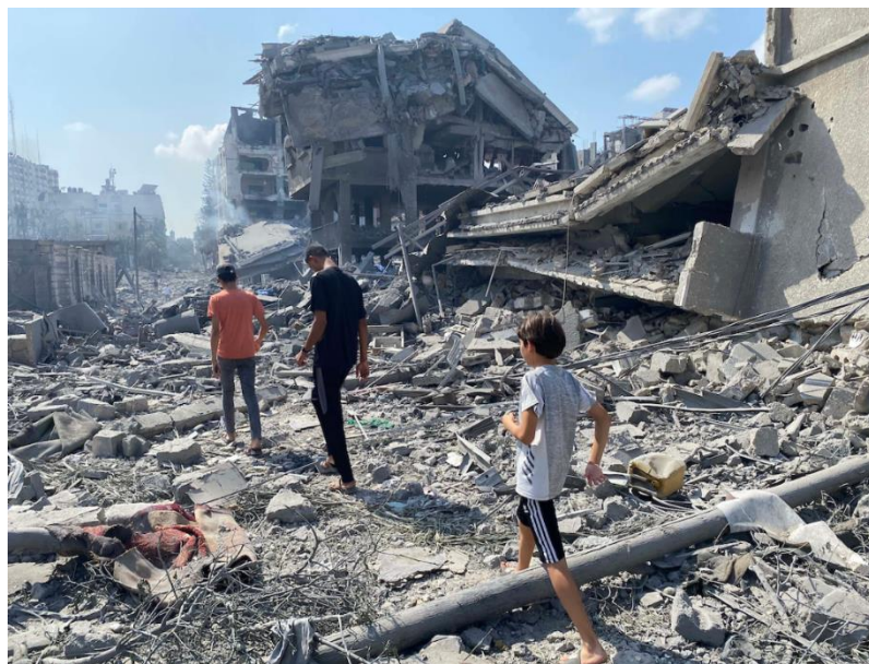
د غزي ترانگي انځور د جگړې ليکي نه