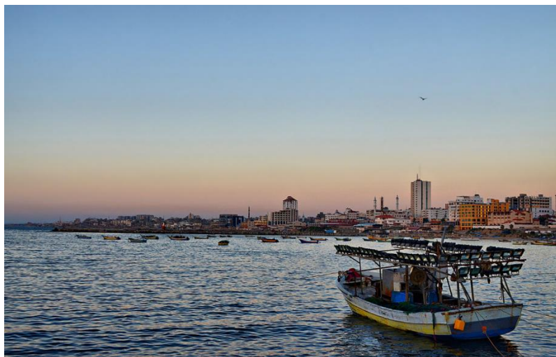
د غزي ترانگي انځور، مخکي د اکتوبر / ۷ / کال ۲۰۲۳ څخه