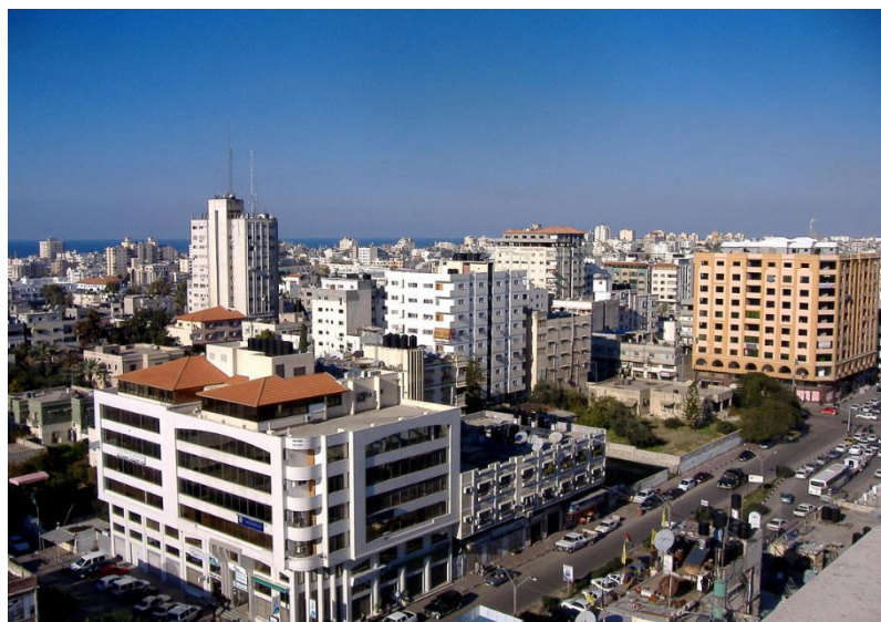
د غزي ترانگي انځور، مخکي د اکتوبر / ۷ / کال ۲۰۲۳ څخه