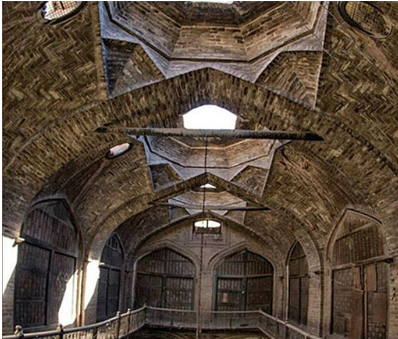
د هرات کاروان سرای انځور د مفکورې ورکولو په اړه