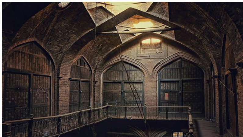
د هرات کاروان سرای انځور د مفکوري ورکولو په اړه