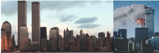
Fig. 1: WTC voor en na 11 september 2001