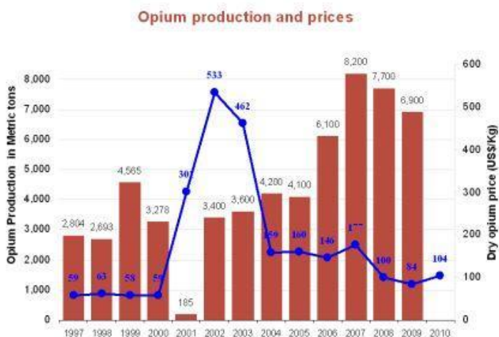
Fig. 7: Opium productie in Afghanistan

Afghanistan is een van de grootste vluchtelingen -landen. Door de oorlog, politieke repressie, onveiligheid, armoede, droogte, hongersnood en andere extreme situaties zijn al in 1980 (0,6mln.), in 1985 (2mln.), in 1990 (6,2mln.), in 1995 (6,4mln.), in 2000 (6,4mln.) en in 2001 (7mln.) mensen uit het land gevlucht. Dus, veel mensen zijn eerst voor de communisten, dan voor de rebellen-regering van de krijgsheren van de Noordelijke alliantie en Mujahedien en daarna voor de Taliban gevlucht.