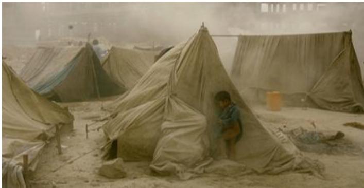
Fig 11: Afghaans vluchtelingenkamp in de hoofdstad Kabul

President Barak Hussain Obama neemt vergelijkbare beslissingen om meer militaire eenheden naar Afghanistan te sturen wat geen vrede of veiligheid tot stand kan brengen. Hiermee heeft hij bewezen dat hij tegen een vreedzame oplossing van het Afghaans probleem is. Er wordt gedacht dat Barak Hussain Obama ten onrechte de Nobelprijs voor de Vrede heeft gekregen wat een vernederend fenomeen voor de Nobelprijs-organisatie is.