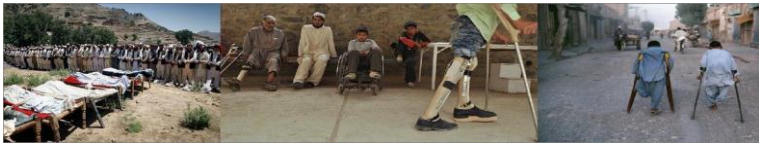
Fig. 5: Slachtoffer van niet geëxplodeerd wapenarsenaal

een ander onderzoek van de VN in Bosnië en in Cambodja blijkt dat 40-50% mijnenslachtoffers sterven aan hun verwondingen. Maar door blinde bombardementen van Amerikanen en het verspreiden van clusterbomen zijn er in de laatste jaren meer dan 200.000 mensen overleden en na het plat bombarderen van de zuidelijke provincies met uranium-houdende bommen is er een duidelijke stijging van aangeboren afwijkingen bij Afghaanse kinderen.