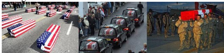
Fig. 2: Amerikaanse, Britse en Canadese slachtoffers van Afghaanse oorlog

In tegendeel: de situatie in Afghanistan wordt dag na dag erger, kosten en het aantal slachtoffers van de oorlog stijgen en er is geen uitzicht op het einde van het geweld in Afghanistan.