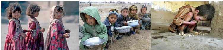
Fig. 9: Afghaanse kinderen in hogersnood

Momenteel leven meer dan 20 miljoen mensen op rand van hongersnood en er zijn meer dan 9 miljoen mensen vluchtelingen in eigen land die in verschillende vluchtelingenkampen wonen. Dus het probleem van de vluchtelingen heeft een zeer negatieve invloed op de gezondheid van de bevolking en de veiligheid van de maatschappij.