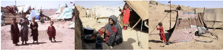
Fig. 8: Afghaanse vluchtelingen in eigen land

Afghanen uit Pakistan en uit Iran terug naar hun land gegaan. Maar deze Afghanen hadden geen alternatief. Want alle internationale hulporganisaties en ook de VN met hun kantoren zijn naar Afghanistan verhuisd en de Afghaanse vluchtelingen kunnen niet zonder hulp van de VN en andere internationale humanitaire hulporganisaties overleven. Alle scholen en andere onderwijsstelsels zijn dicht gegaan of naar Afghanistan overgebracht. In zo'n situatie heeft men geen keuze. Dus moet men om de hulp die nodig is om te overleven, maar naar de hel gaan.