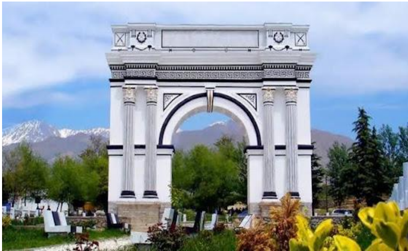
تصویری از تاق ظفر ولسوالی پغمان