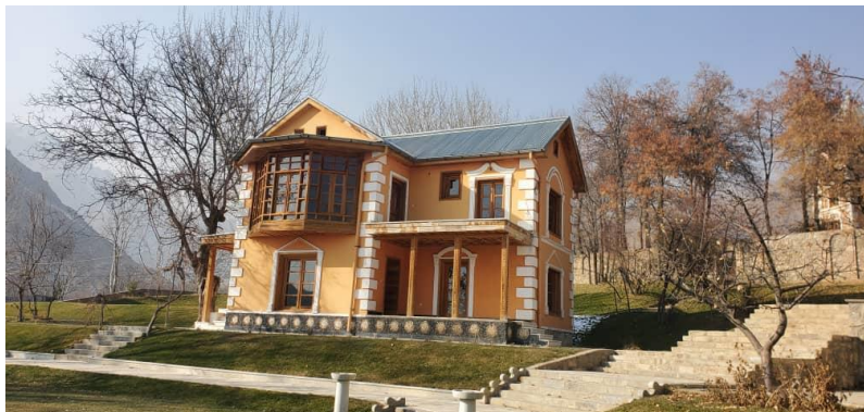
تصویری از پایان کار باز سازی بالا باغ پغمان