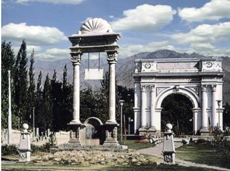
تصویری از تاق ظفر ولسوالی پغمان