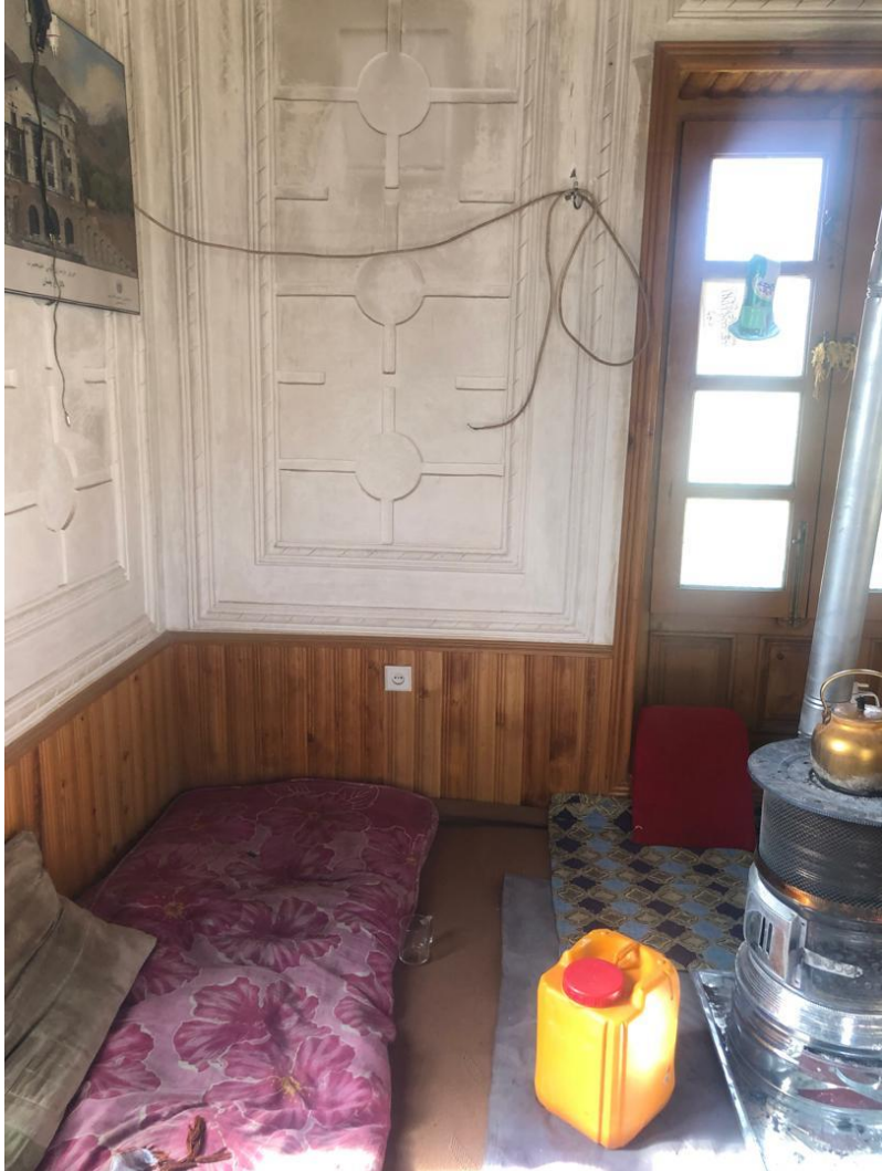
تصویری از قسمتی داخلی قصر تاجدار در بالاباغ بامان