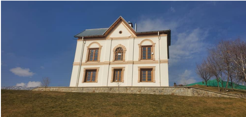
تصویری از پایان کار باز سازی بالا باغ پغمان