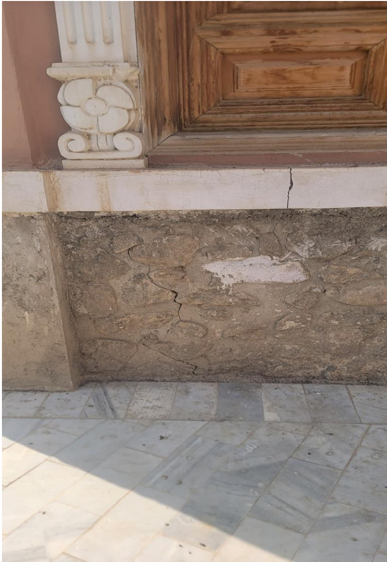
تصویری از ترک (درز) عمودی در ساختمان حرمسرا