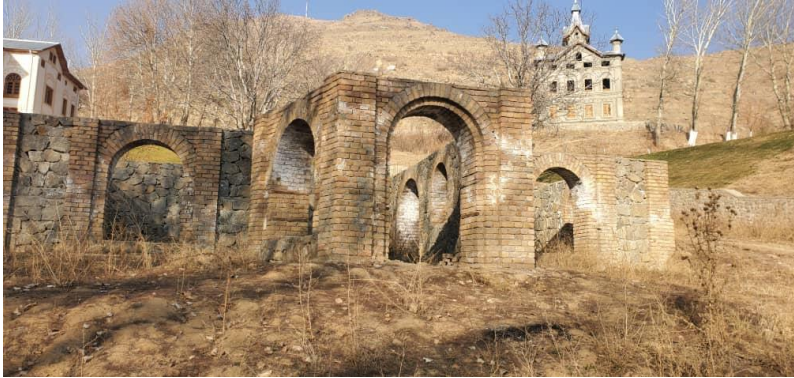
تصویری از جریان کار باز سازی بالا باغ پغمان