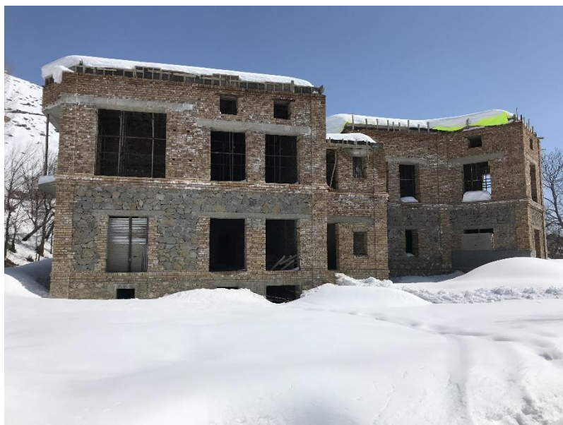
تصویری از قصر حرمسرا در جریان ساختمان

..... چیزیکه قابل یاد آوری درین قصر است همانا عدم تناسب و تطبیق دروازه ها و کلکین های رویکار آن است که اندازه های عرض و ارتفاع آن با هم یکسان نبوده و تا دقت نشود، تفکیک آن هم کاری آسان نیست، این نواقص جزیی که میتوان در وقت تطبیق اصلاح میشد، صرف توسط چشم معماران و انجنیران با تجربه قابل تفکیک است.