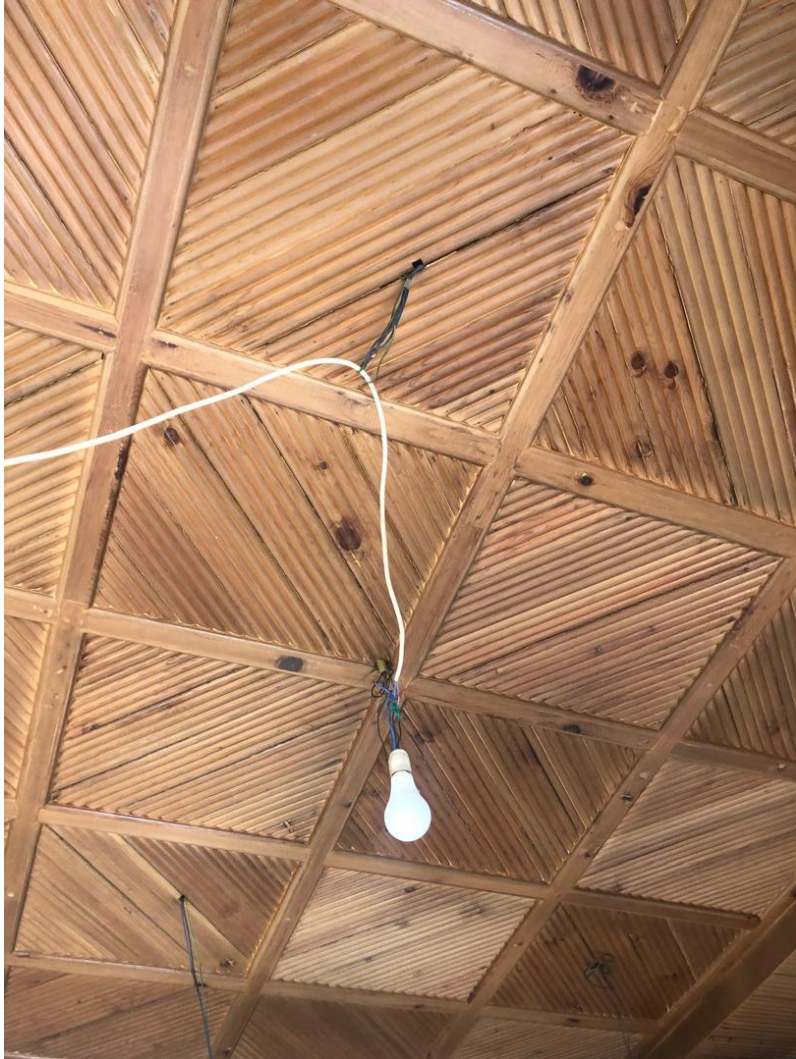
تصویری از مسطح سقف داخلی قصر تاجدار در بالاباغ پغمان