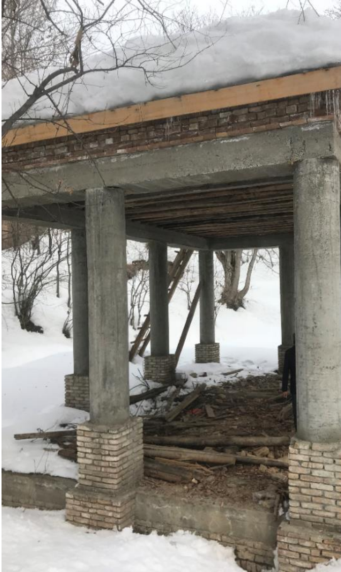
تصویری از چوب تره مستطیلی واقع بالا باغ پغمان