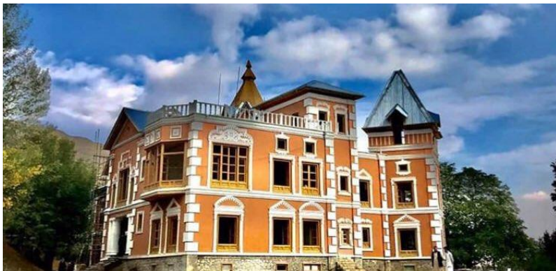
تصویری از قصر حرمسرا در بالاباغ پغمان