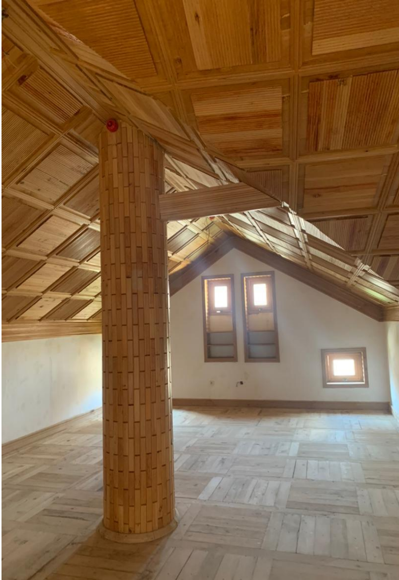
تصویری از ساختمان داخلی حمام و تشناب