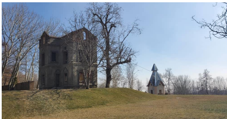
تصویری از قصر تاجدار در بالاباغ پغمان

با گذشت بیش یک ساعت از شروع آتش سوزی تیم آتش نشانی به محل نرسیده و مردم تلاش می کنند آتش سوزی را مهار کنند. این شهروند گفت که این بنای تاریخی به طور کامل در آتش سوخت. « (۴)