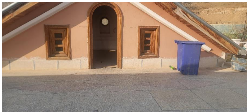
تصویری از ترک (درز) افقی در ساختمان حرمسرا

با تیم متخصصان دکتر فیکسیت که در زمینه راه حل های ضد آب و حفاظت از خانه آموزش دیده اند، یک تماس مشاوره سریع می تواند راه حلی برای جلوگیری از آسیب های قابل توجه، نفوذ آب و هزینه های ناخواسته باشد. امروز با پر کردن فرم زیر با دکتر فیکسیت تماس بگیرید. (۳)