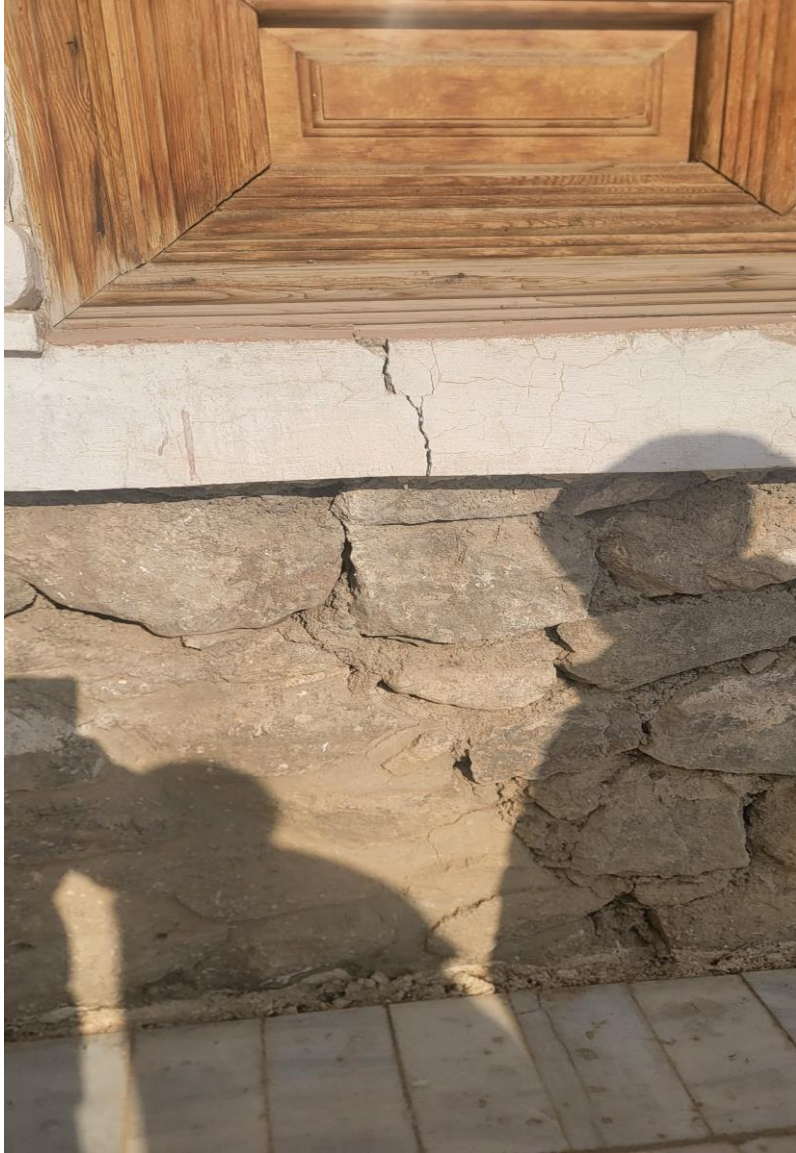
تصویری از ترک (درز) عمودی در ساختمان حرمسرا