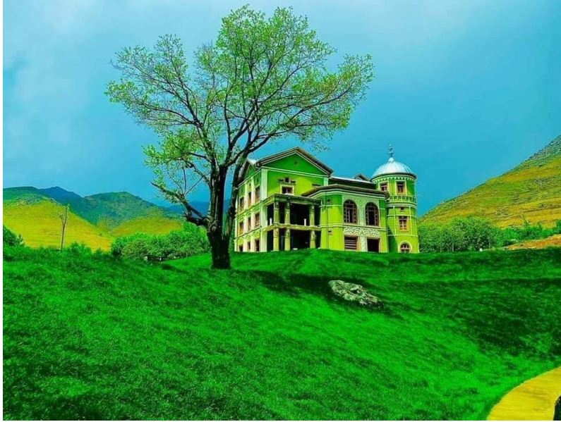
تصویری از بالا باغ پغمان