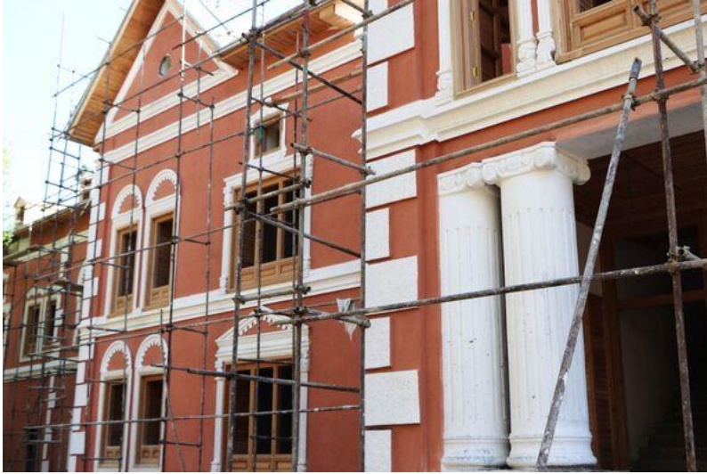
تصویری از قصر حرمسرا در بالاباغ پغمان