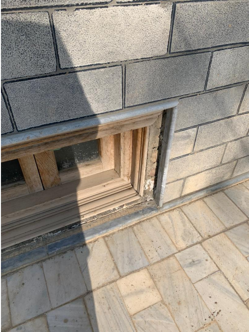
تصویری از نیمه کاری کلکین