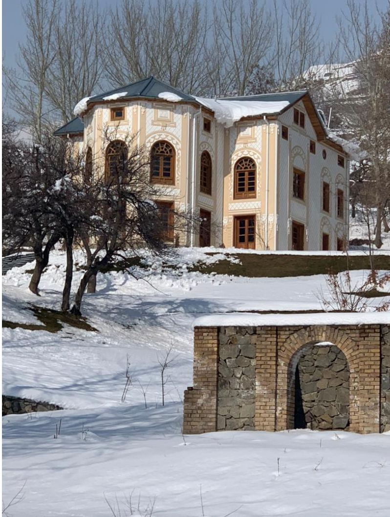
تصویری از جریان کار باز سازی بالا باغ پغمان