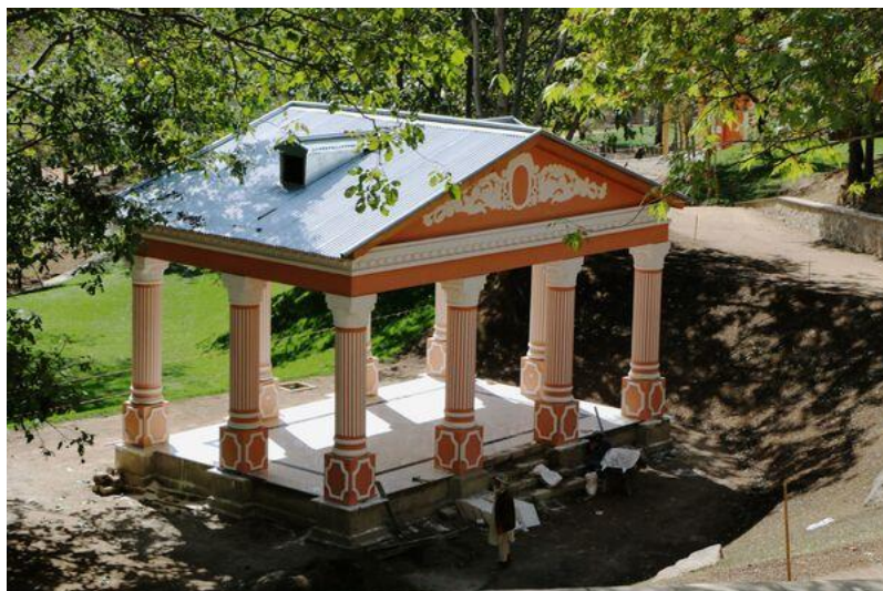
تصویری از چوب تره مستطیلی واقع بالا باغ پغمان