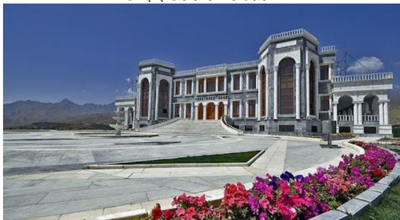
تصویری از قصر مرمین تپه پغمان

ناگفته نباید گذاشت که در فصل های بهار و تابستان خصوصاً جمعه ها مردم زیاد کابل و ولایات برای میله به این مناطق زیبا می روند. نکته ای که باید خاطر نشان کرد این است که اکثراً مردم کابل و ولایات برای میله (گردشگری) به دره پغمان می روند اما قریه هایی