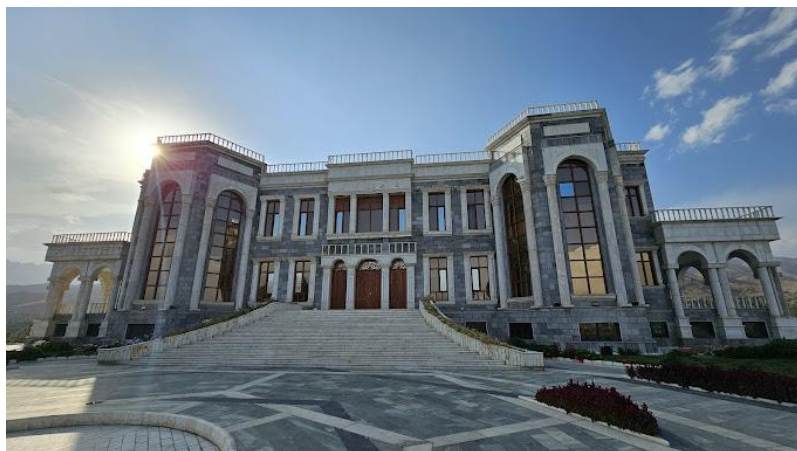
تصویری از قصر مرمین تپه پغمان