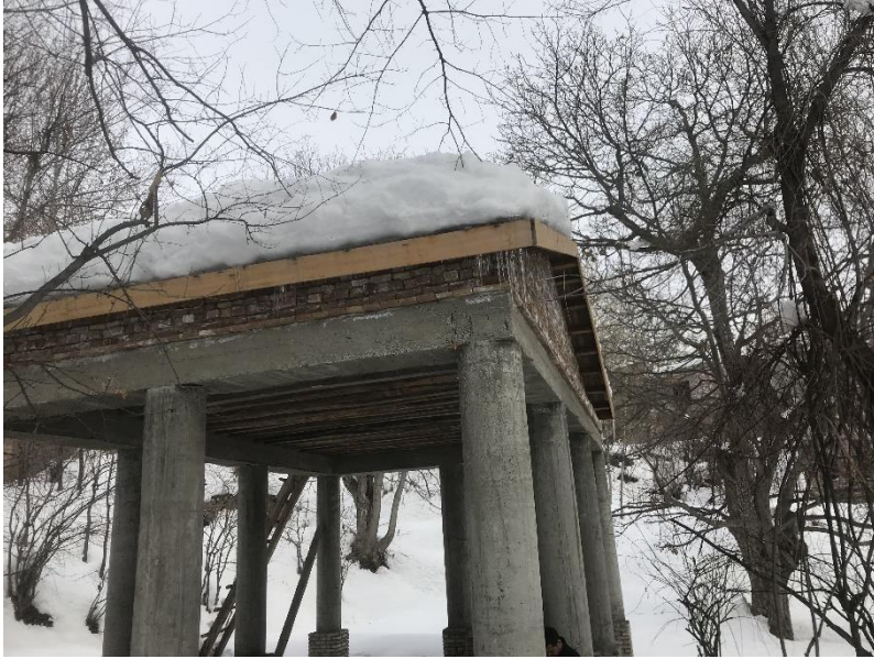
تصویری از چوب تره مستطیلی واقع بالا باغ پغمان