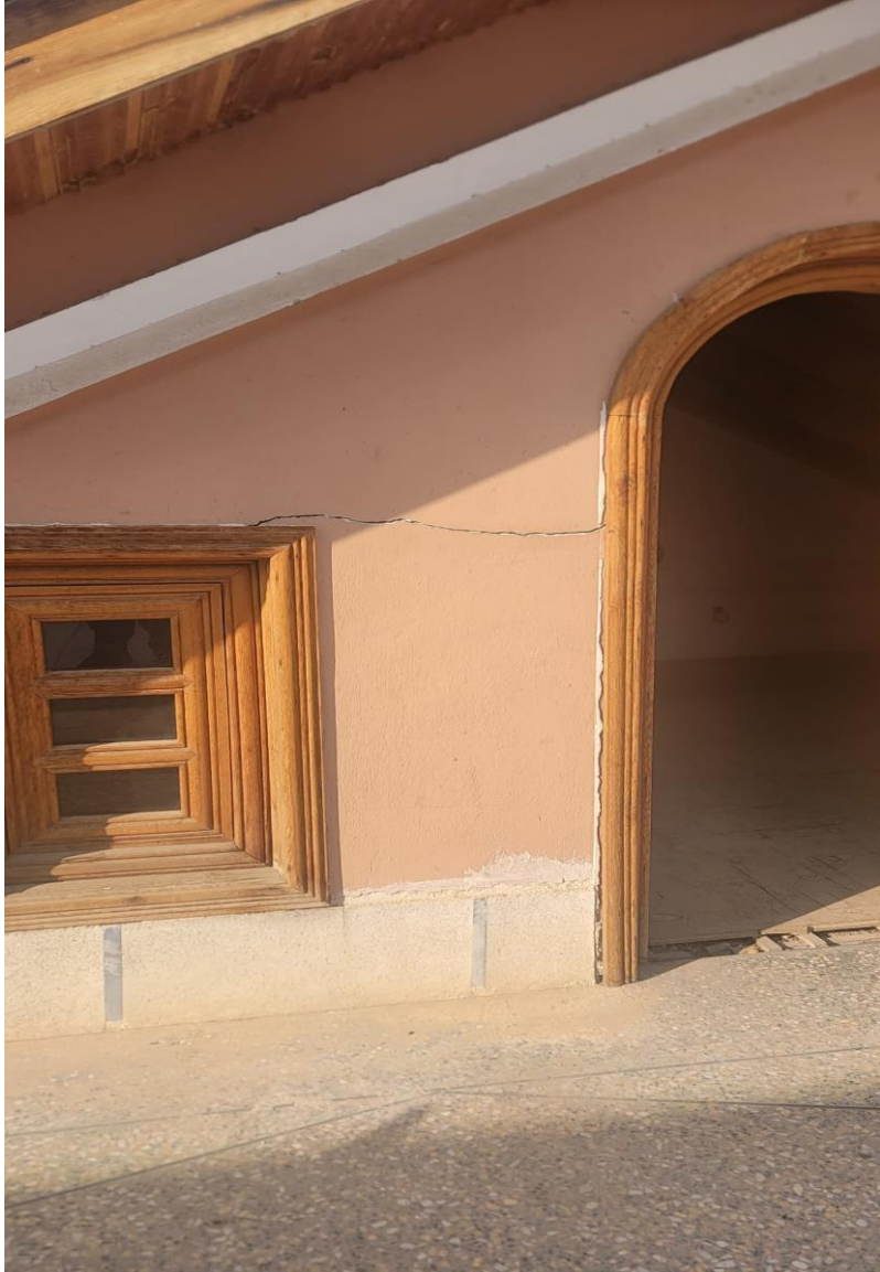
تصویری از ترک (درز) افقی در ساختمان حرمسرا