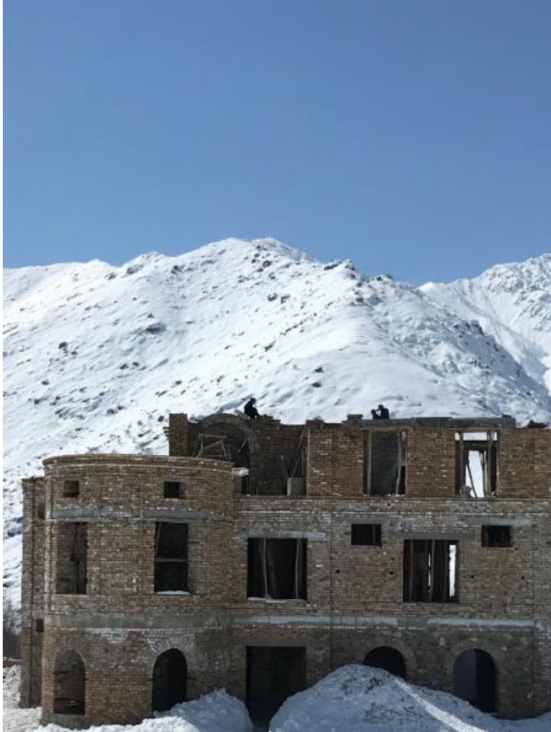
تصویری از قصر حرمسرا در جریان ساختمان