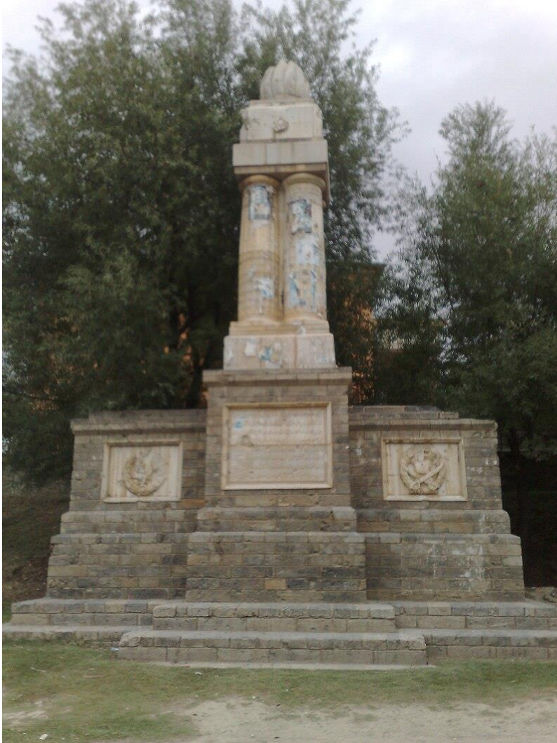
تصویری از بنای یادبود (مانومنت) در ولسوالی پغمان